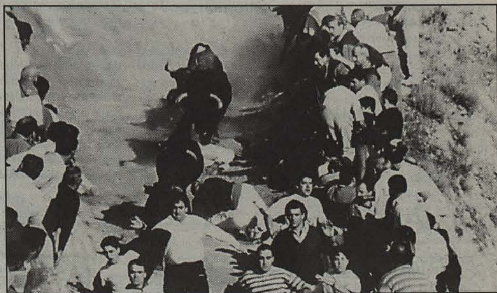
Bigantxek estropozuka jaisten dute 449 metroko malda. Ibilbide meharretik kanpo amildegia besterik ez dago. JOXE LACALLE

terako, Sadabakoak eta Casetas-koak izan dira jaietako lehen egunetan.