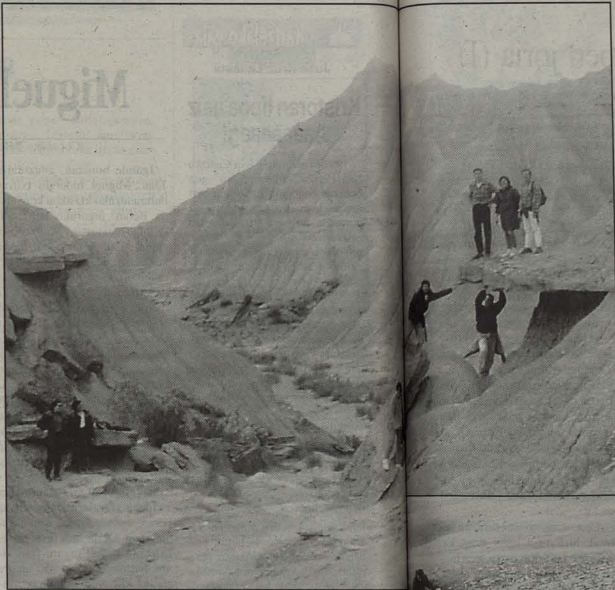
Natur gidarien eskutik hamaika ibilaldi egiteko aukera dago Nafarroan