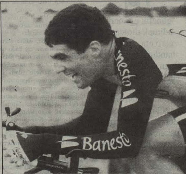
Ez dute ziurtatu Indurain izanen den.

Beratarra Txirrindularitza Taldeak antolatu duen proba honek urtetik urtera zaletu gehiago du. Orain hiru urte, parte-hartzaileak 500 inguru izan ziren, hurrengo urtean 750 inguru eta ia 980. Aurten, mila txirrin-