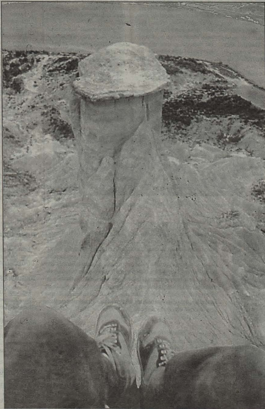
Landa turismorako enpresa berriak sortu dira aurtan Nafarroan.

eta txango atseginen bidez ingurunea eta kultura ezagutaraztea da natur gidari berrien helburua. Etorkizuna, ordea, ez da baxterea argia eta irautea da natur gidarien erronka.