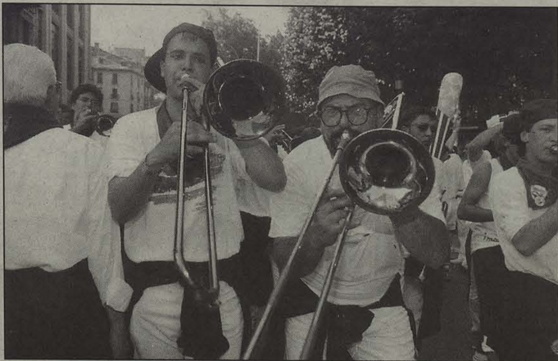
Sanjoanak eta Euskararen Eguna nahasiko dira asteburu honetan.