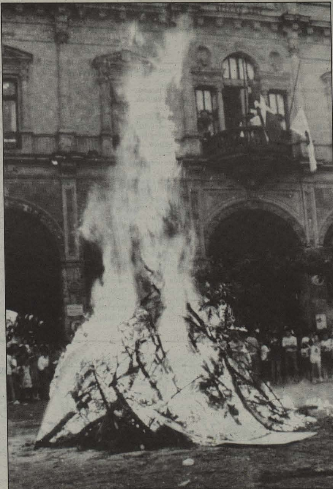
Sanjoanak Euskal Herriko jai berezietakoak dira.

Igandean izango da azken eguna, eta goizeko zortzietan