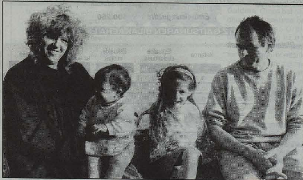
Artistak, amentsetako beren tokian.

JYPE GAY. —Britainian ginearik arbel gainean tindatzen genuen, nun nahi aurkitzen genuelako. Bestalde, egurra edo oihal arruntak baliatzen ditugu. Duela urte pare batzuz, hasi gara pilotan erabiltzen palak tindatzea ikusiz lagun batentzat egin genuena pareta zintzilikatu zuela pollita atxeman zuelako. Pentsatu dugu bazela merkatua eta geroztik produktua arrakastatsua bilakatu da. Ezagutarazi gaitu eta jende ainitz etortzen dira gure gana aurpegiaren tindatzeko paletan. Euskal Herria tindatzeko materiala egokia iduritu zauku, ur txortaren formarekin, ilusioa ematen du sarrailaren zilotik sekretua begira-