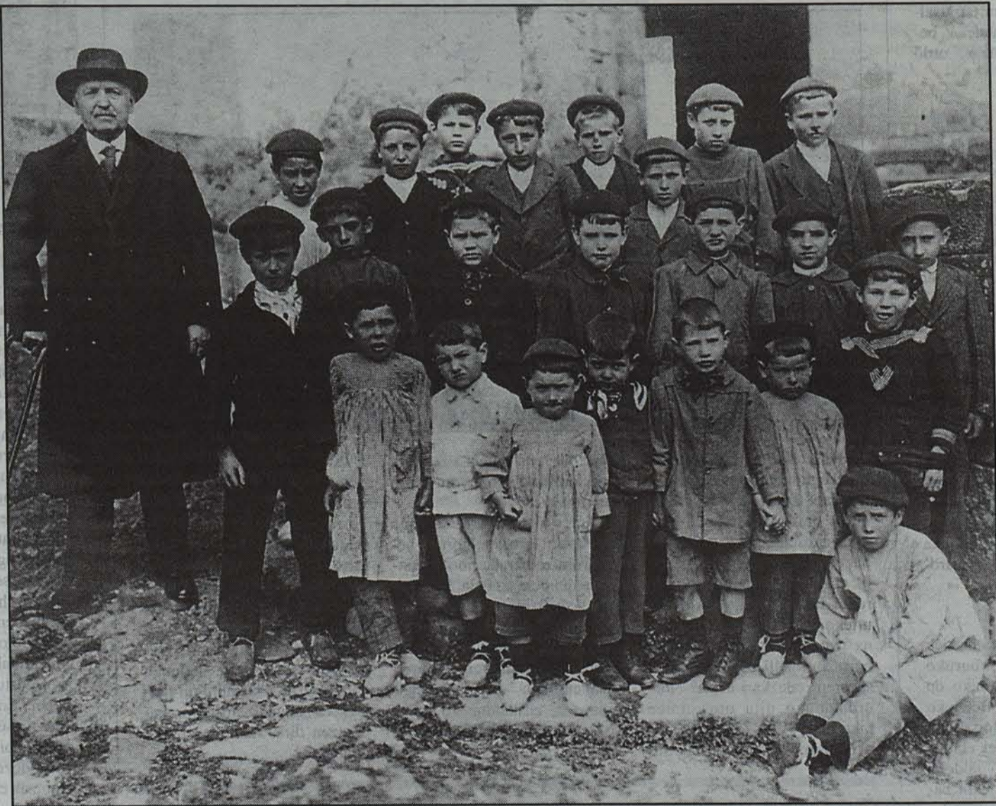
Errepublika garaiko Zubietako eskolako umeak.

teko harremanak sendotzeko proiektu bati esker jaio baita garai hau jorrazteko ideia, eta, hori dela medio, ikasleek aukera izan dute ohartarazteko historia ez dela bakarrik historia liburuetan azaltzen dena, baina inguruarekin lotuta dagoen zerbait bizia.