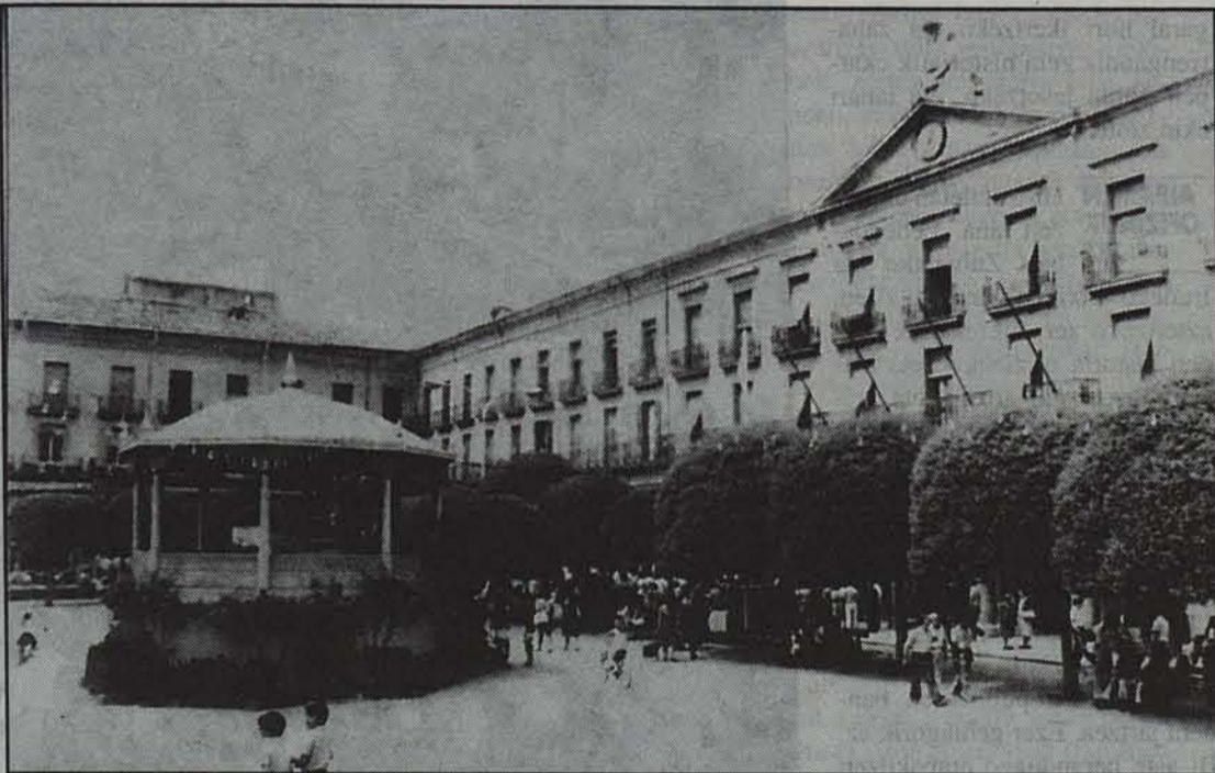
25 urte hauetan Tafallako bizitzan eragina izan du ikastolak.