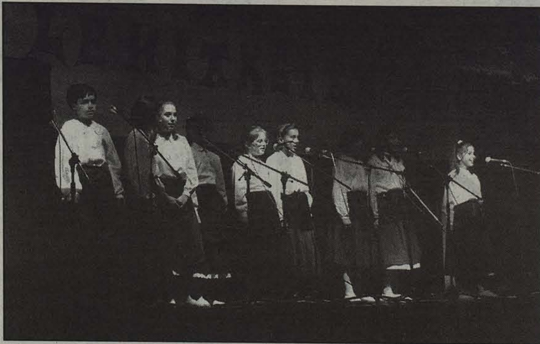
Nafarroako bi finalak egingo dira heldu diren egunotan.

Kantariak banaka, binaka edo taldeka ariko dira, haur eta gaztetxoan mailan, 22 denetera, gure herrialdeko anitz lekutatik etorritakoak. Ondoko hauek dira eta azalduko ordenean abestuko dute: Berako Labiaga ikastolako Ttipitarri taldea; Lekunberriko Lorea eta Nerea; Paz de Zigandako Piperminak taldea; Iruztungo Ziripot taldea; Jaso ikastolako Maite eta Miren; Lesakako Tantirumairu taldea; Ultzamako Belate San Julian bakarlaria; Lekunberriko Gabai taldea; Altsasuko Katakax taldea; San Fermin ikastolako Haizea bikotea; Lizarrako ikastolako Koblakariak taldea; Elizondoko ikastolako Bi baztandar bikotea; Paz de Ziganda ikastolako Txepetak taldea; San Fermingo Maitzi bikotea; Lekunberriko Aralarko Kantariak taldea; Be-