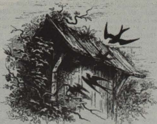
'Grandville-n iruditan euskal erretratuak' liburuko ilustrazioa.

Erantzuna: Orain modatan jarri da nor bere adineko ba-