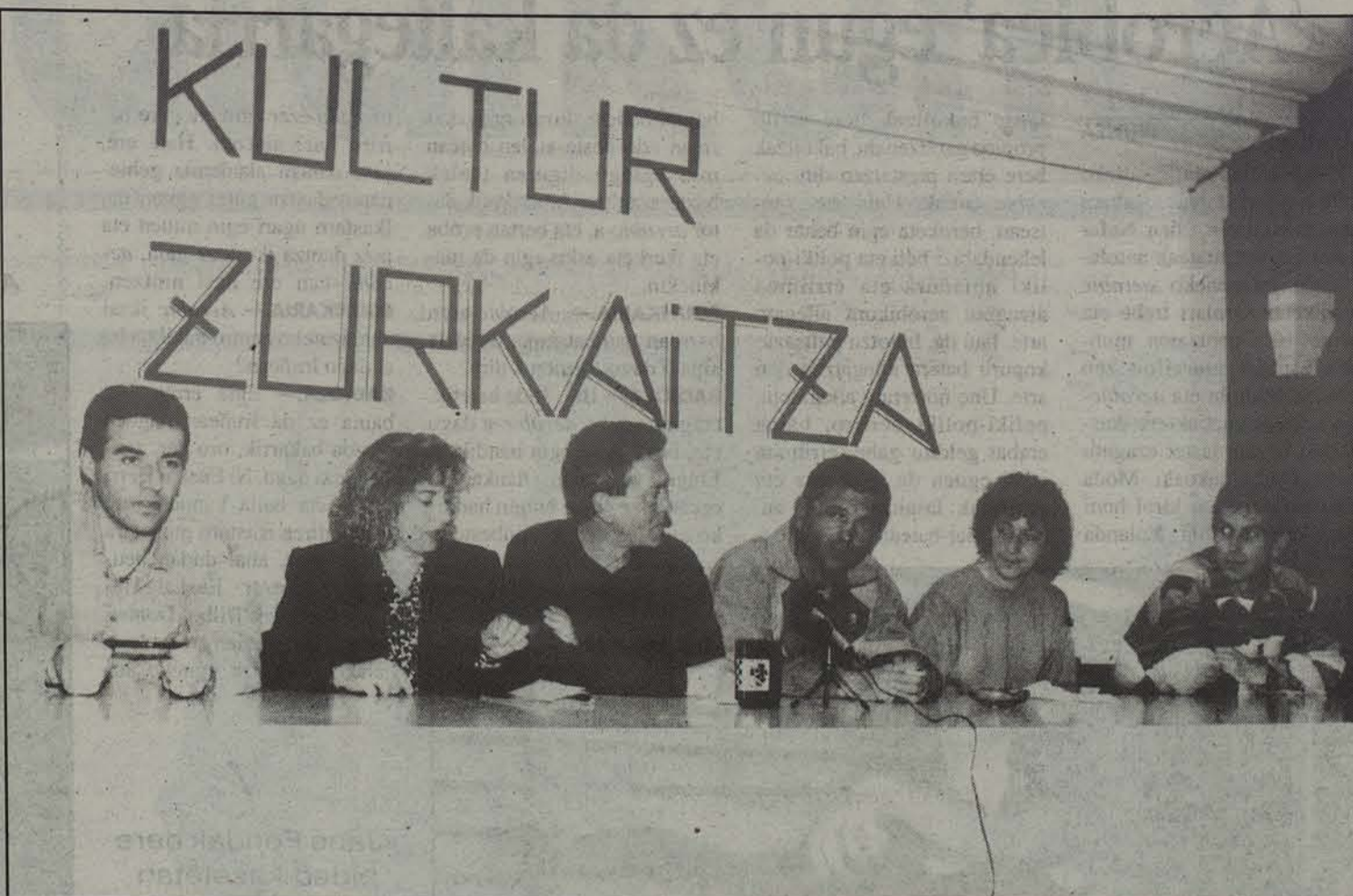
Zurkaitza elkarteko partaideak, aurkezpen egunean.

T alde batzuek ez dute oraindik euren partaidetza erabaki, Bertizko Partzuergoarekin izan litekeen harremana dela eta.