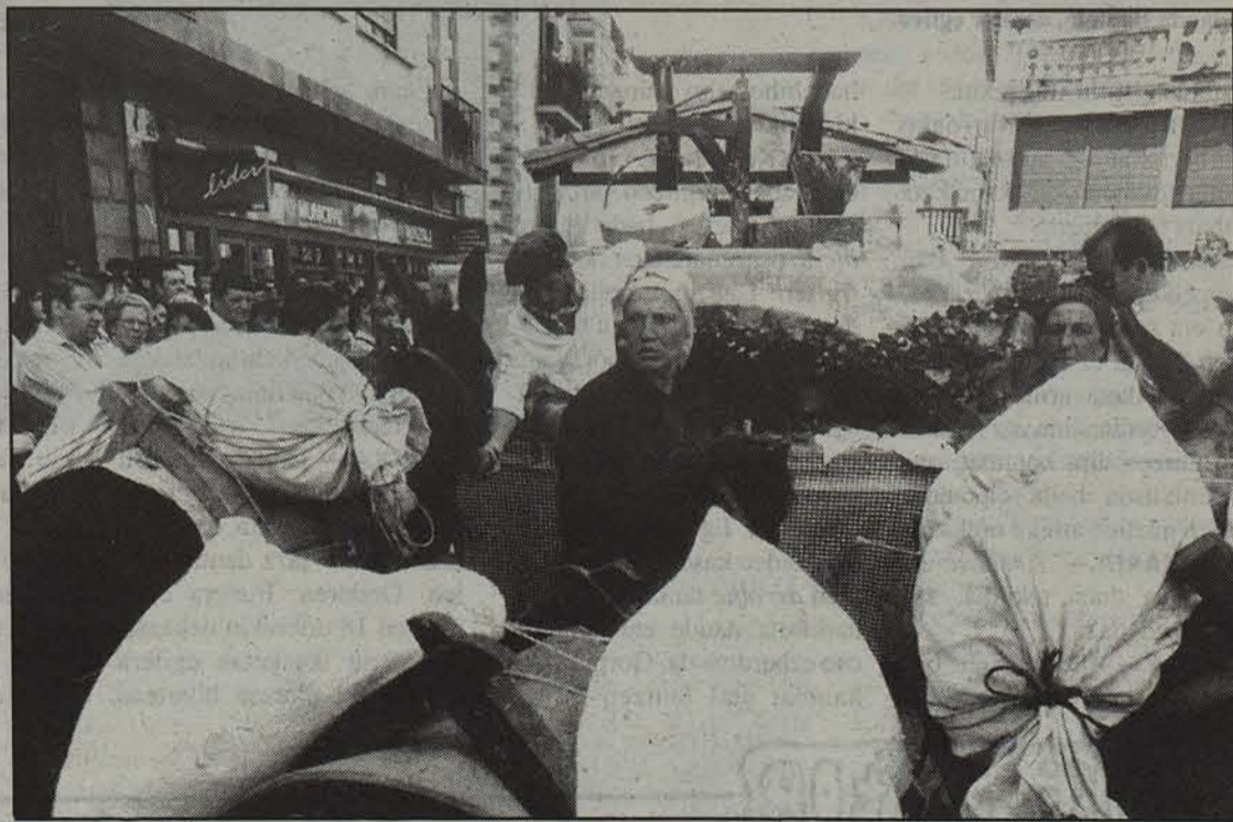
Baztan-Bidasoa inguruan ekintza kultural bateratuak egiteko sortu da Zurkaitza.