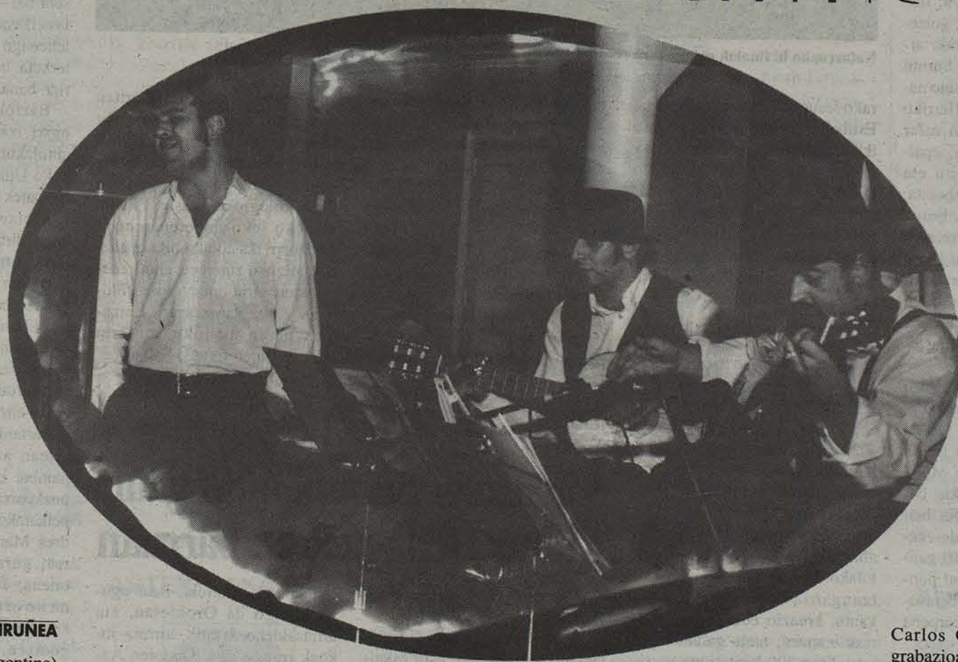
Gaurko emanaldian mende hasierako giroa gogorarazi nahi du Los Morochos taldeak, eta eszena-tokia horretarako prestatuta dago. IRINTA