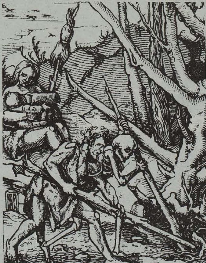
Pamielak argitaratutako 'Caines navarros' liburuaren ilustrazioa.

Galdera: Argi lkara. Argiastea baino lehen, unetxo bat izaten da non gaueko txoriak ixildu egiten baitira, eta egunekoak kantatzen hasiak ez. Oihanean unetxo horretan ez da deus ere aditzen. Hortxe ere izaten da jaio eta hiltzeko gehien usatzen den tenorea. Udara gorrian ere hotza egiten du unetxo horretan. Unetxo horretan amets sexuak mutikoen mairidireak zikintzen dituzte alegiazkoari halako kutxu errealista emanaz. Alemanieraz badago propio hitz bat unetxo hori izendatzeko. Halaxe esan zidan neska alemaniar batek, eta harrez geroztik oroitzen naiz Argi lkara hartaz. Duela hogeita hamar urte. Ni garai hartan andre alemaniar batekin hartu-emanetan hasi nintzen. Argi lkara hartan, iluntasunaz baliatuz, bere alaba nire ohean sartu zen. Neskatxa