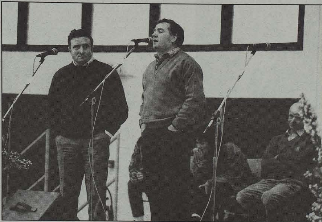
Bertso saioa girotzeko ekitaldiak prestatu ditu Langarra taldeak.