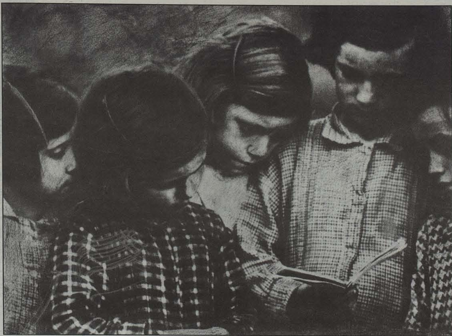
'Ipuina', Miguel Goikoetxearen lanetako bat.

Nafarroako gehigarria / Ostirala, 1995eko martxoaren 10a / VI. urtea / 169. zenbakia