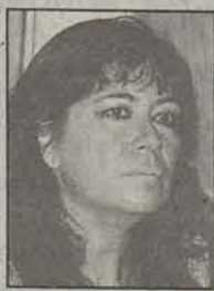
Cristina Narbona Ingurugiro Idazkaria

Azken asteetako gertakarien ostean jakina zen Miguel Sanz Gobernu lehendakariordea izanen zela UPNko zerrendaburu hurrengo hauteskundeetarako, Juan-Cruz Alliren ordeaz. Eta larunbatean, azken bozketan, horrela izan zen, Korellakoak 134 botu lortu baitzituen, eta Allik, berriz, 47 besterik ez. Pozik agertu zen Miguel Sanz, eta «integrazio» mezua zabaldu zuen, alderdi barruko gatazkak aldentzeko. Bera zerrendaburu izanda, Allik baduela lekua bere taldean azpimarratu zuen Sanzek, eta bertan izango dela espero duela. Istilu ugari izan dira egun hauetan UPN barruan baina azkenean alderdi buruek irabazi dut, alde handiarekin gainera.