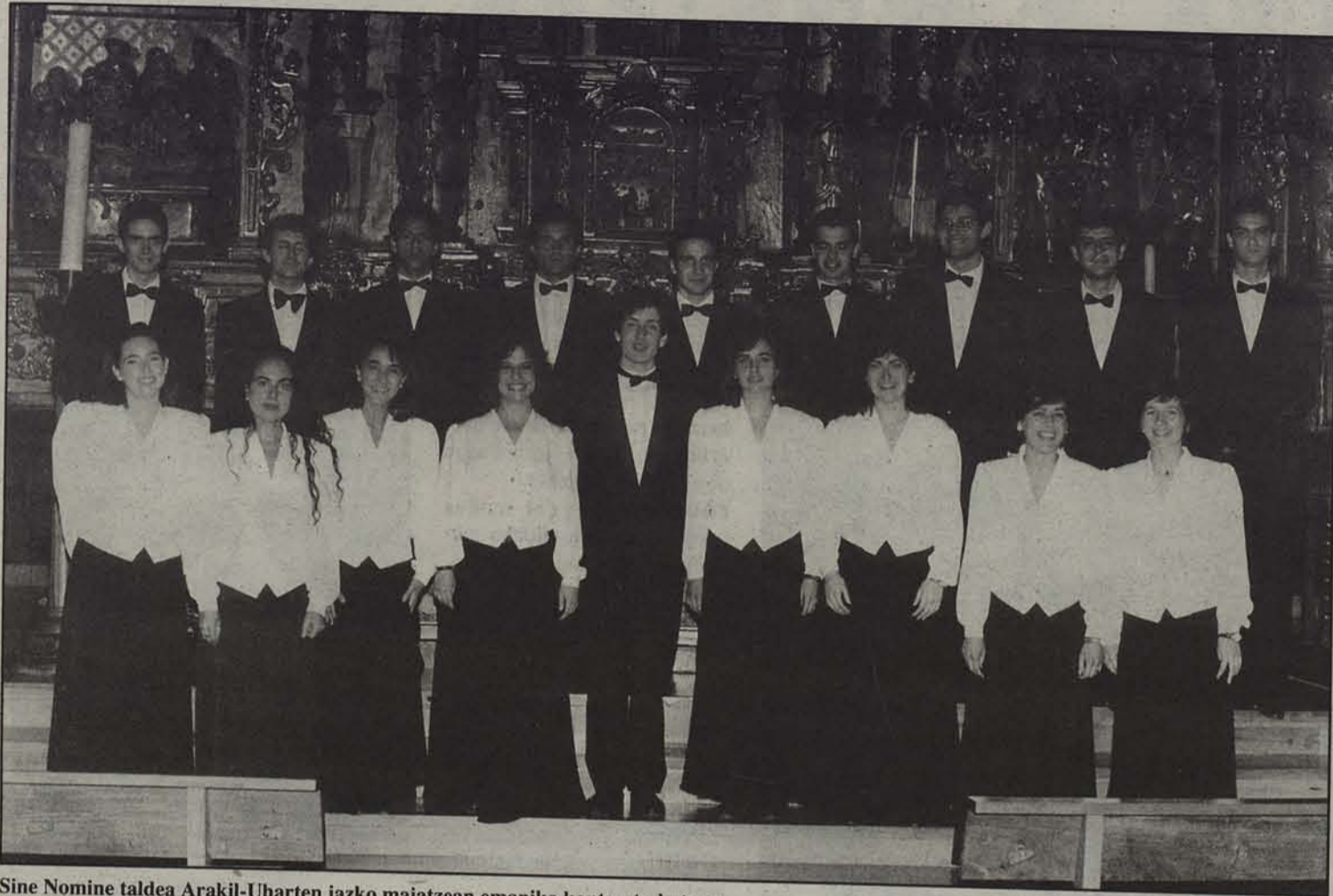
Sine Nomine taldea Arakil-Uharten iazko maiatzean emaniko kontzertu batean.

S ine Nomine Musika Tailerrak urte bukaera ederra eta bikaina izan du. 1993ko urrian Gironan izan zen Interprete Berrien Espainiako Lehiaketan lehen saria jaso ondoren, Madrilan, Vigon, Valladoliden eta Medina del Campon izan dira kantari. 1990ean sortua, XX. mendeko ahots-lanak jorratzen dituen koru honek konposagile gazteen lan franko estreinatu ditu bere bost urteko ibileran.