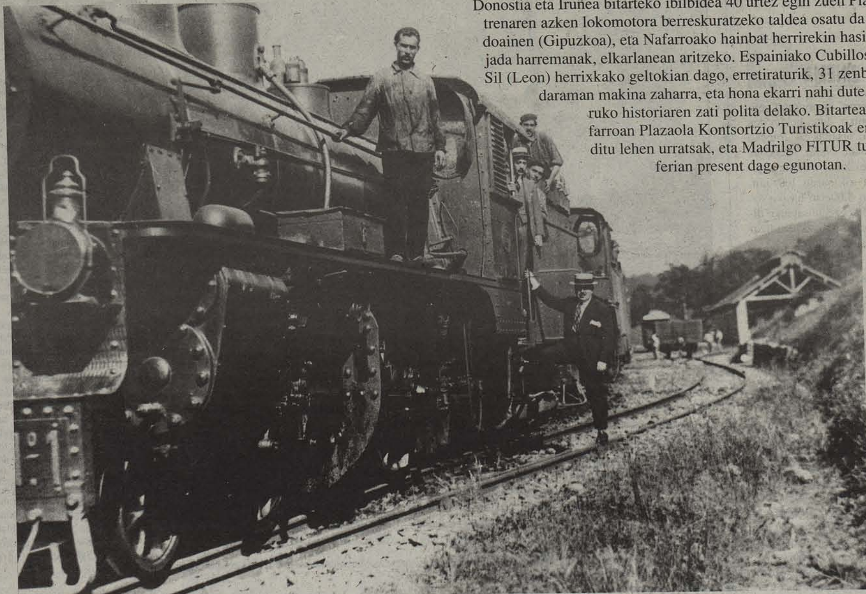
31 lokomotora Leonen lanean aritu zen garaian.

Donostia eta Iruñea bitarteko ibilbidea 40 urtez egin zuen Plazaola trenaren azken lokomotora berreskuratzeko taldea osatu da Andoainen (Gipuzkoa), eta Nafarroako hainbat herrirekin hasi ditu jada harremanak, elkarlanean aritzeko. Espainiako Cubillos del Sil (Leon) herrixkako geltokian dago, erretiraturik, 31 zenbakia daraman makina zaharra, eta hona ekarri nahi dute, inguruko historiaren zati polita delako. Bitartean, Nafarroan Plazaola Kontsorzio Turistikoak emanak ditu lehen urratsak, eta Madrilgo FITUR turismo ferian present dago egunotan.