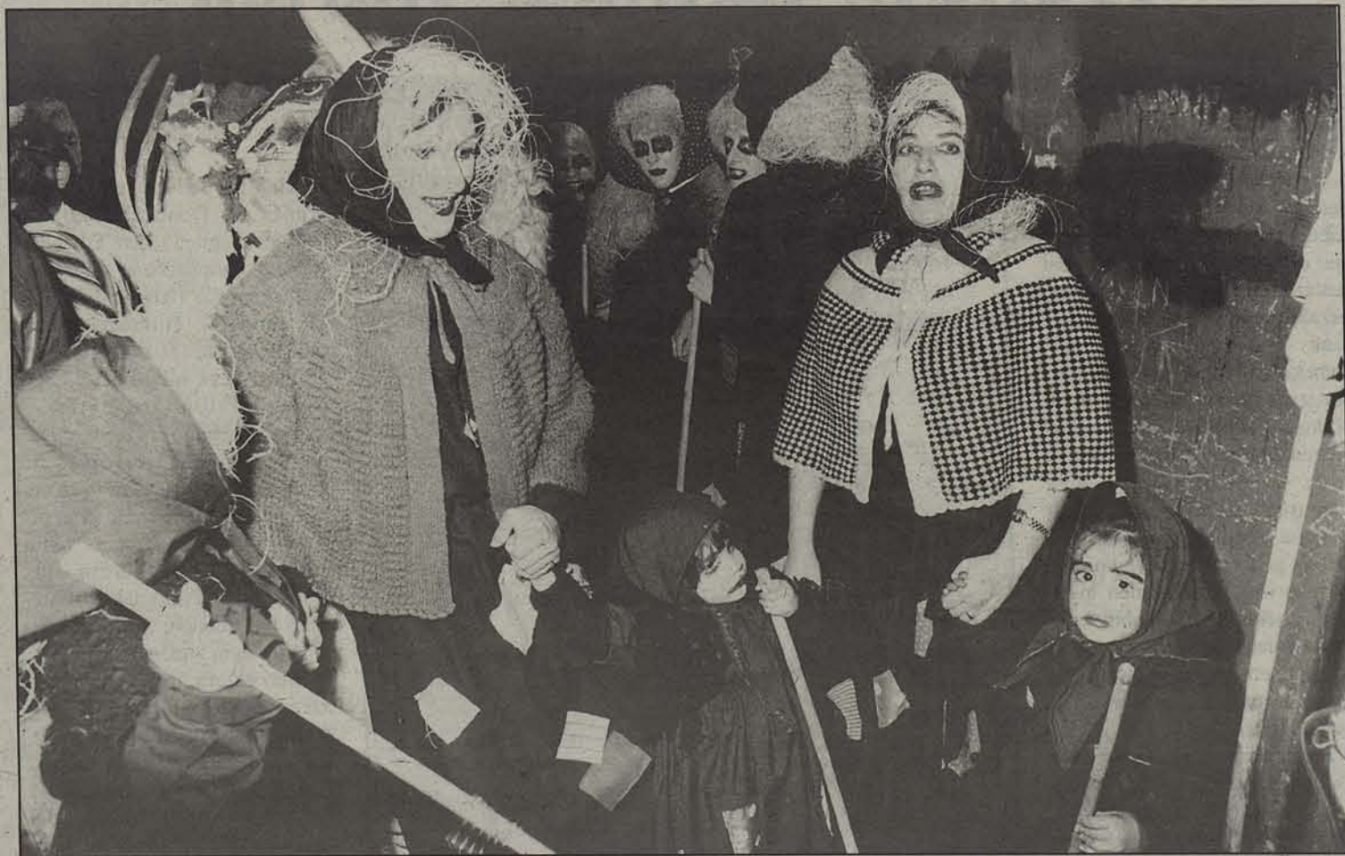
Sunbillak zabalduko du Nafarroako inauteri garaia.

Aldaketa guztiak ikusgai daude udaletxean herritar guz- tiek ikus ditzaten, eta astero hit- zaldiak ematen ari dira zonalde horien etorkizunaren inguruan. Erakusketa publikoaren ondotik, alegazioei erantzun zaje, eta ondoren Udalak onartuko du. Azken erabakia Nafarroako Go- bernuak hartuko du.