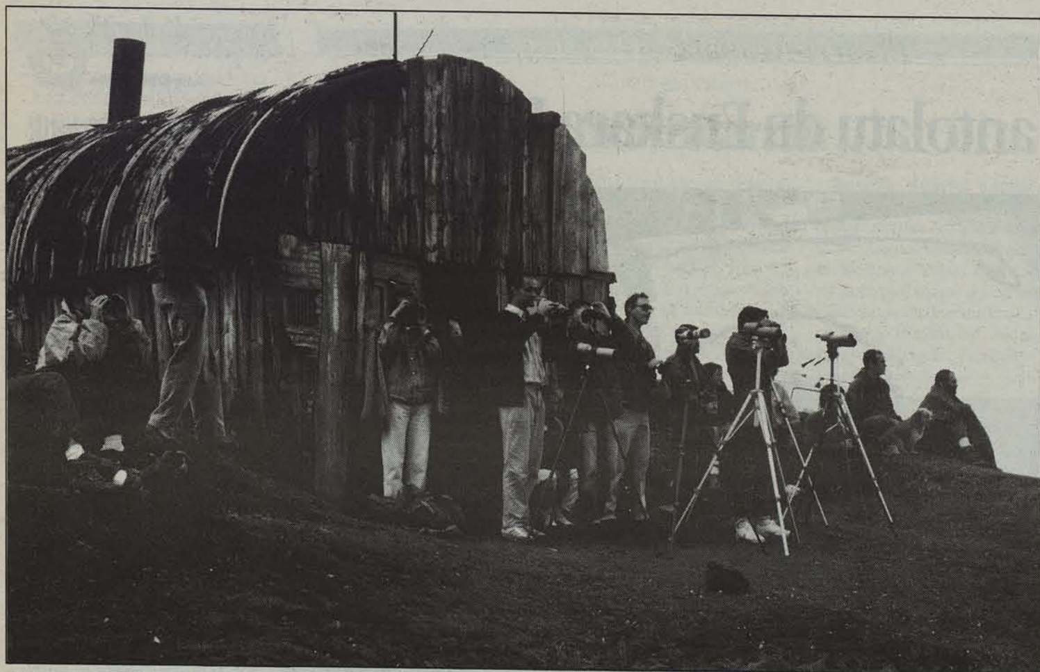
Linduxen urtero biltzen dira Ugatza taldeko partaideak ikerketa egiteko.