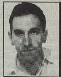
Angel Garcia Etxandi Idazlea

ZORTZI— Guztira, entelekia, batuketa bikoiztua —neutroa? nuloa?—. Orden zapaltzaile bat, hondakinen gainean eraikia, baina hondakinez, iraultzaile ez bezala. Eta hondakin ugaltzaile, birziklatzailearen kontrara. Zabalitzen baita zapalduz, haunditzen baita txikituz, SOÑANDO CON LA PAZ Haimdenburg. Borobiltzen baita kua-drutuz —sofistikoki, demagogikoki, martzialki—.