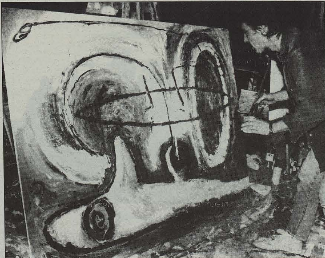
Erakusketan Sakanako herrietako datuak ikusi ahal izango dira.