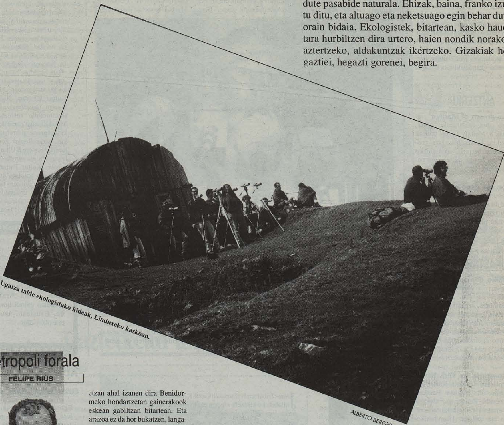
Ugatza talde ekologistako kideak, Linduxeko kaskoan.

Uztailean heltzen dira, beroak dagoeneko gogor jotzen duenean. Haiek, ordea, negua eta hotza bu-ruan. Azarora arte zeharkatuko dituzte milaka ki-lometro, iparraldeko lurralde hotzetatik Afrika edo Iberiar Penintsularen epeltasunaren eske. He-gazti migratzaileak dira, eta Nafarroako kaskoak dute pasabide naturala. Ehizak, baina, franko izu-tu ditu, eta altuago eta neketsuago egin behar dute orain bidaia. Ekologistek, bitartean, kasko haue-tara hurbiltzen dira urtero, haien nondik norakoa aztertzeko, aldakuntzak ikertzeko. Gizakiak he-gaztiei, hegazti gorenei, begira.