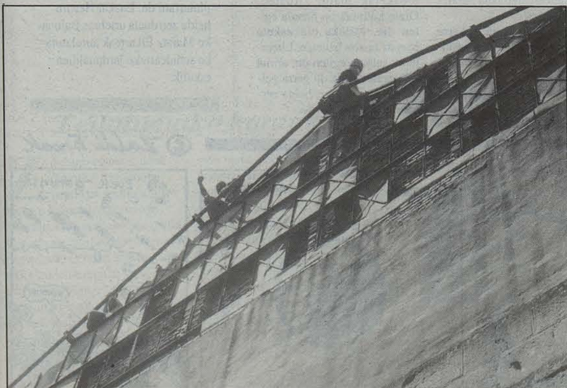
Okupatzaileak goizean egotzi zituzten Euskal Jaitik.

Argudio horietan oinarriturik, eskolak bi irtenbide aurkeztuko dizkio Udalari, Alde Zaharra ez uzteko xedearekin. Batetik, Irakasle Eskolaren San Jose plazara egoitza ohia izatea NAEren egoitza. Bestetik, San Agustin kaleko orubean eraikiko diren etxebizitzak berrietan beheko solairua NAErentzat gordetzea.