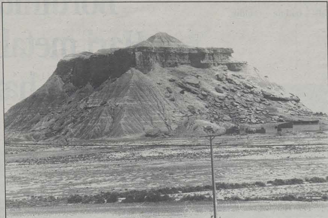
Bardeei buruzko astea ospatu da Tuteran.