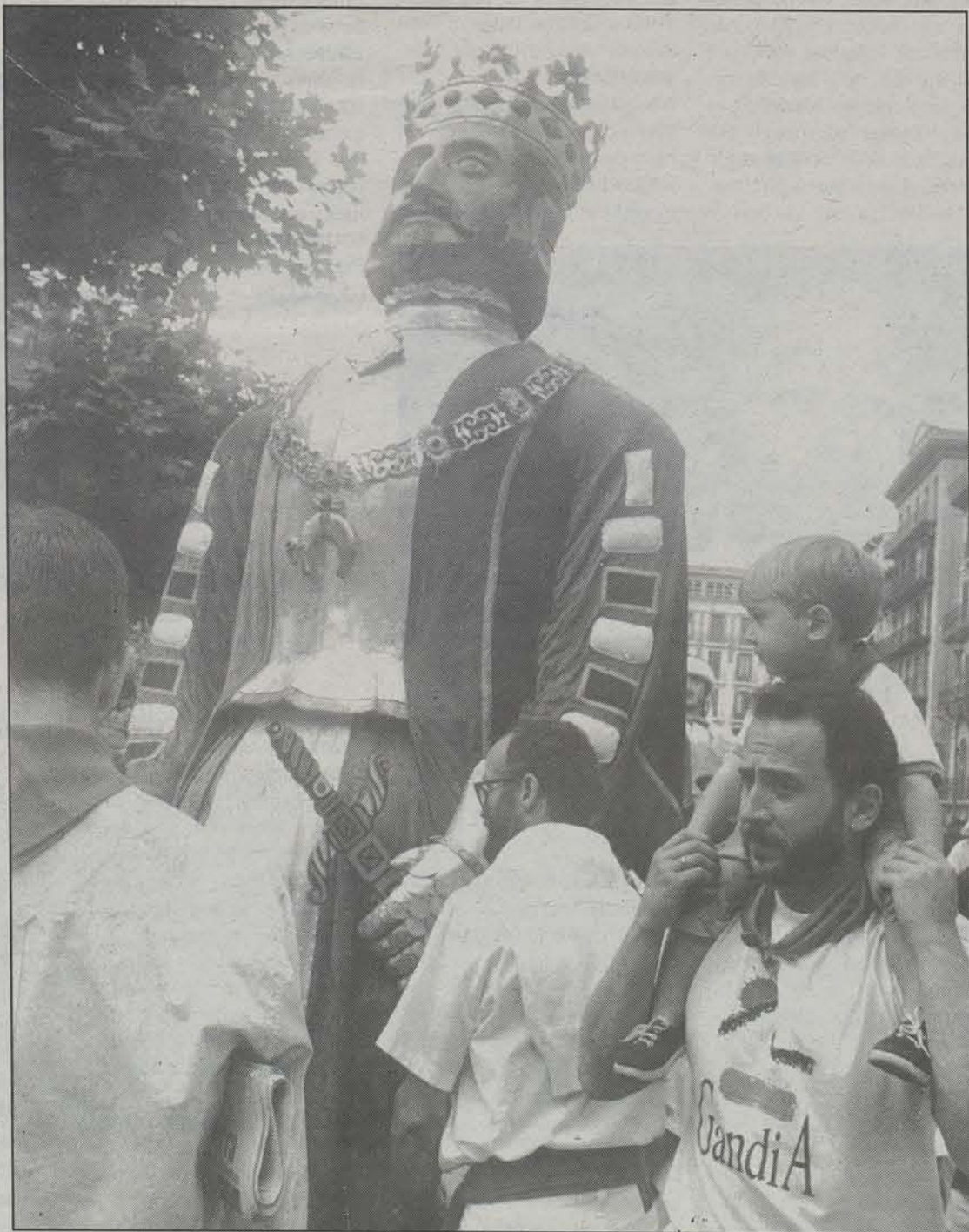
Sanferminetarako prestaketan gogor ari dira erraldaien konpartsak.