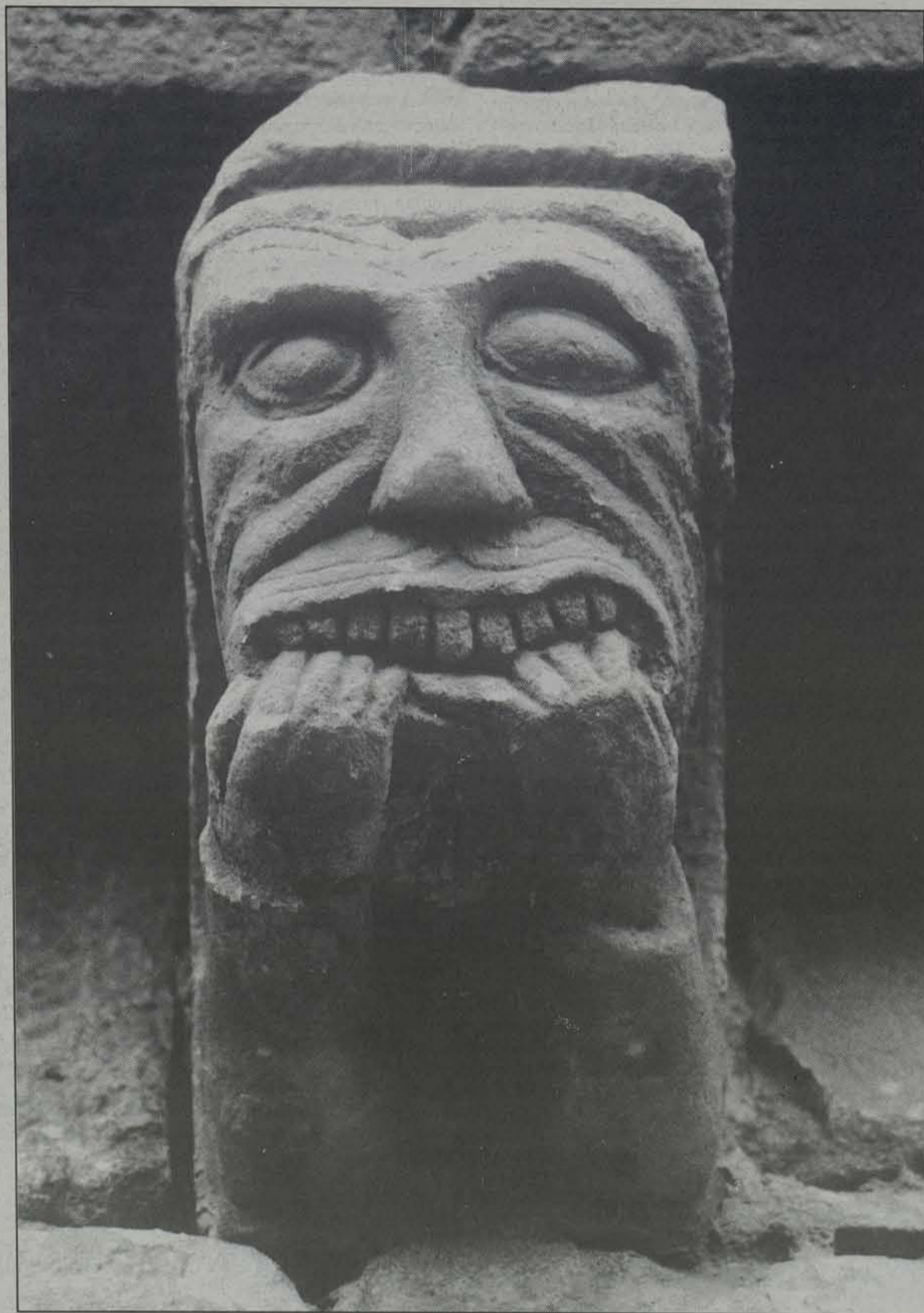
Artaizko elizaren irudi bat.

Nafarroako gehigarria / Ostirala, 1994ko apirilaren 29a / IV. urtea / 125. zenbakia