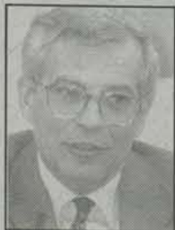
Josep Borrell Herrilan ministroa