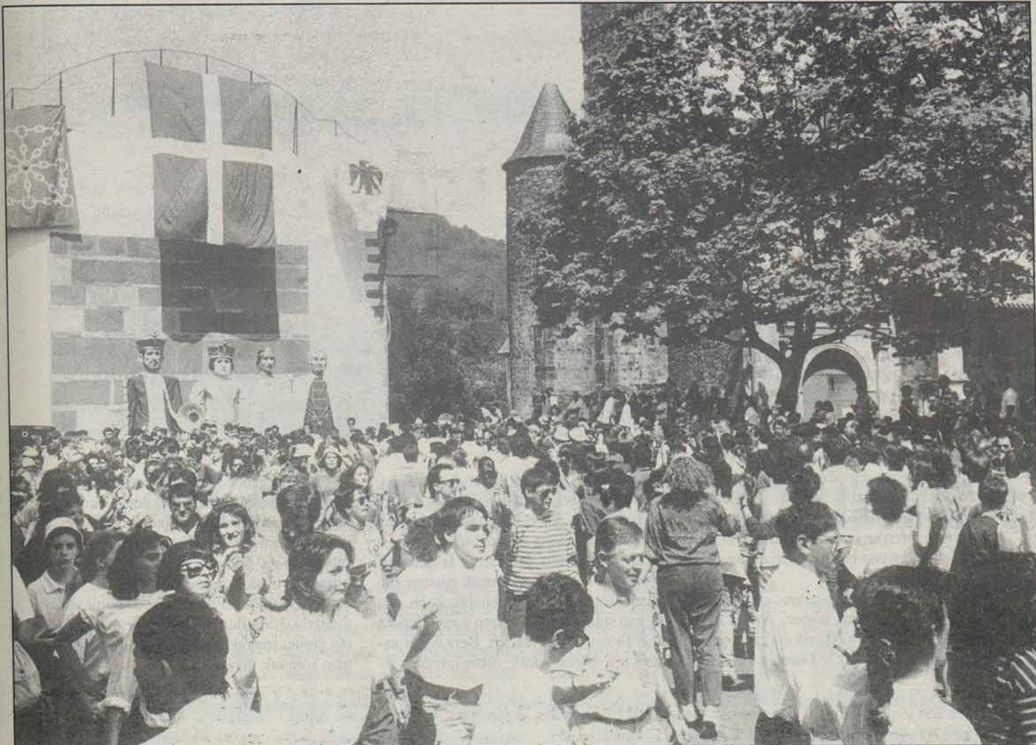
Baigorriko kaleak nafarrek beteko dituzte aurten ere.

Maiatzaren 1a , igandea, Lasako sagardotegian: Basaizea elkartearen bazkaria.