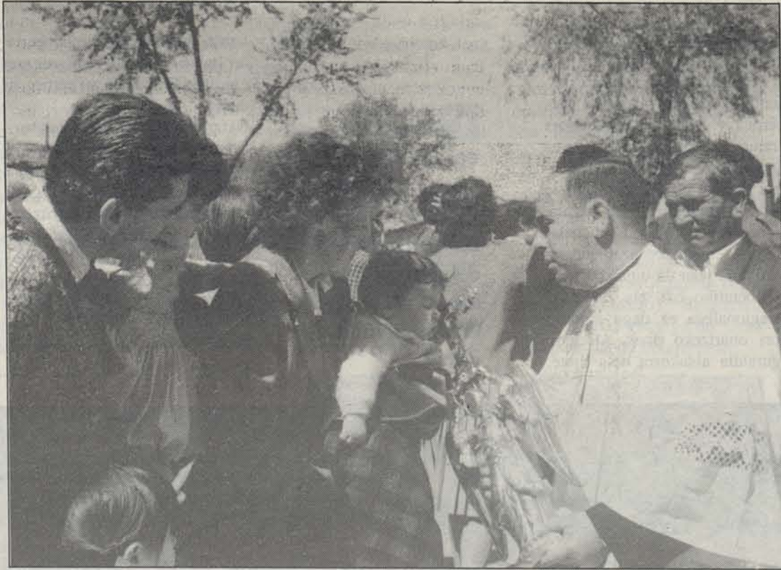
Aspaldixkoko da Nafarroa osoan irudiari harrera egiteko ohitura.

Horrela hasi zen ibilaldia, tra- dizioz zamarrik, bistan da. Iru- ñea osoa ezezik Nafarroako ipa- rraldea ere kurrituko du; igan- dean izanen du azken eguna Iru- ñerrian, eta hortik aurrera herriz herri ariko da San Migel, gaixoak bedeinkatzen. Gaur Nafarroako Ospitalean hasiko da, goizeko 8.45etan, eta ondoren Santa Catalinako eskolan izanen da, eguerdian. Hortik Osasun Publi- kiko Institutua eta Iruñeko Au- rrezki Kutxa bisitatu ondoren, Misericordia Etxera joanen da, 13.30etan. Arratsaldean Arrondo Klinikara joanen da irudia, eta 5.00etan Angelicas bisitatuko di- tu. Ondoren, Salestarrak, Kar- meldar Aitak eta, 19.15etan, Frantzisko Xabier parrokian izanen da. Hortik Anaitasunara eta 21.15etan Auroroak izanen dira. Larunbatean falta diren pa-