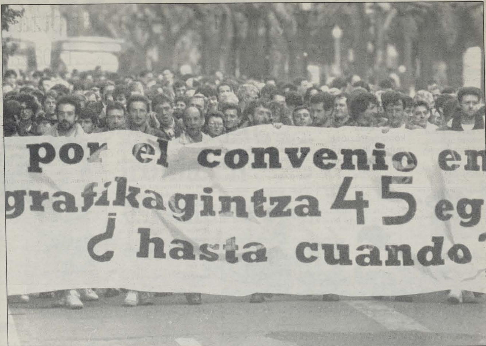
Asteartean egindako manifestaldian.