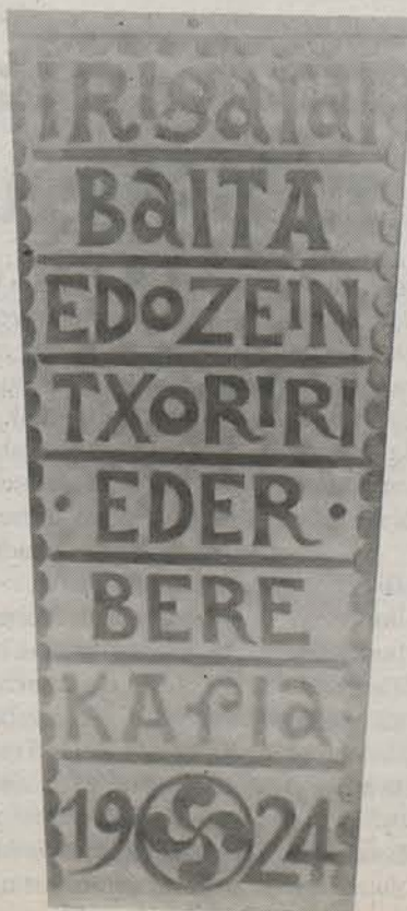
Iruñeko Paulino Caballero egoitzan arte gainean paraturiko harria.

Idazteari lotzea izan zen, beraz, isolamendu horretatik ate-