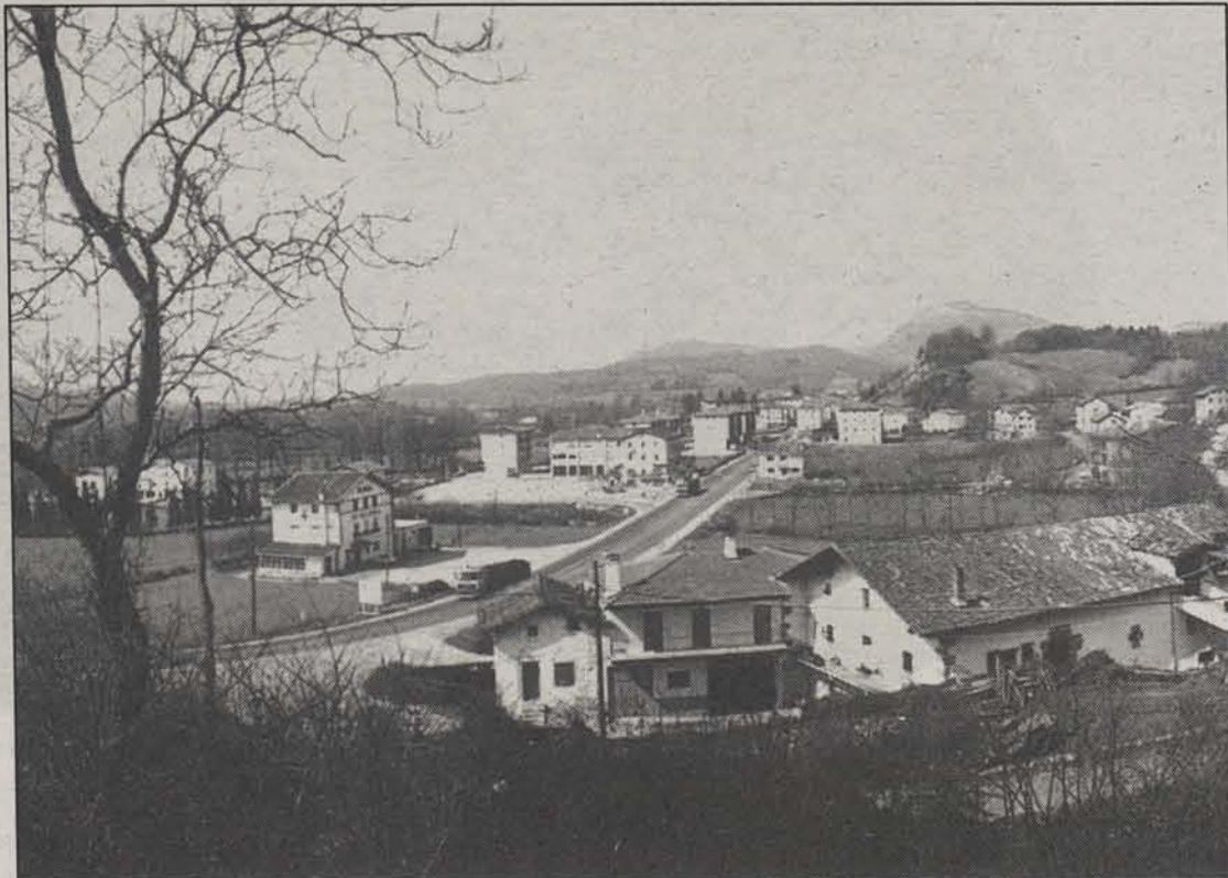
Hizkuntz Politikako Zuzendariak izanen dira Lekunberrin.

BETELU-ARAIZKO ASTE KULTURALA Betelu-Araizten, bestalde, Euskararen Astea ari da ospatzen aste hone-