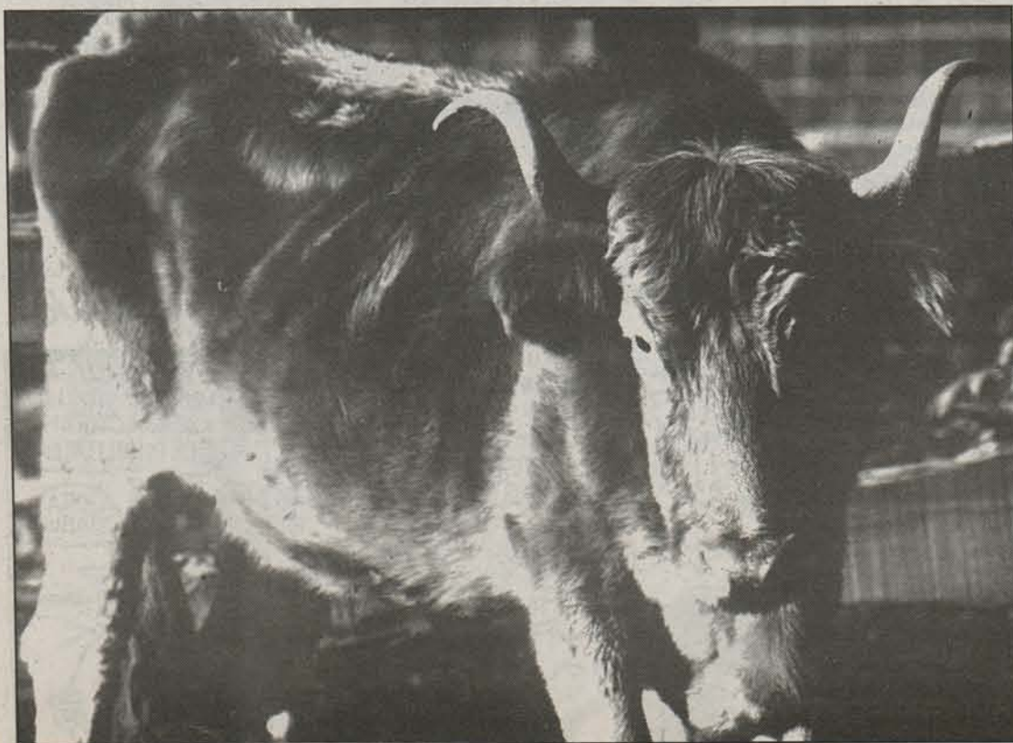
Ilea dute gorputz osoan, eta aurreko aldeak franko handiagoak.

Bertan azaltzen denez, abere arraza hauek funtsezkoak dira, hainbat arrazoiengatik: kalitatezko produktuak eman ditzakete, ekoizpen hutsari hainbeste erreparatu gabe; zonalde atzeratuetan giza jarduerari eusteko oinarri garrantzitsuak dira; eta ingurugiroa babesteko funtsezkoak izan daitezke. 500 burutik beherako kopuruak dituzten behi arrazak sartzen dira sail honetan, eta mila burutik beherako ardi eta ahuntz arrazak. Iraupena ziurtatzeko zenbait neurri —«premiatzeko neurri»— proposatzen dira. Behi arrazandako animalien eta azienden sailkapena egitea; abeltzainei informazio nahikoa ematea; hazi erreserbak lehenbailehen ziurtatzea; posible den heinean, hobekuntza genetikorako programak burutzeko —beti ere aniztasun genetiko neurri handian galdu gabe—; eta arrazen ikerketa bultzatzea, informazioa zabaltzeko. Ardi eta ahuntz arrazek arazo handiagoak sortzen dituzte. Lehendabizi animalia eta azienden sailkapena egin behar da, baina malgutasunez jokatu behar azpimarratzen du txostenak, Europako hegoaldean bereziki oso zaila baita horrelakorik.