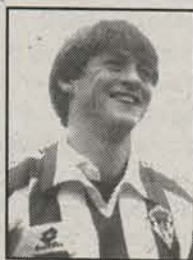
Thomas Christiansen Futbolari