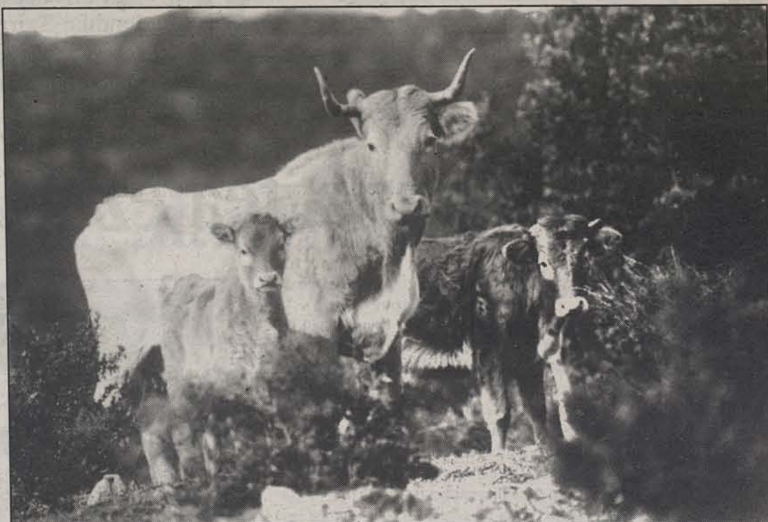
Betizu taldea, joan den abenduan, Zarikietan.

DIPUTAZIOAK AKABATUTA ZARIKIEGIN Etorkizuna, baina, ez da oso ona. Basaburua eta Bidasoa inguruan daude buru