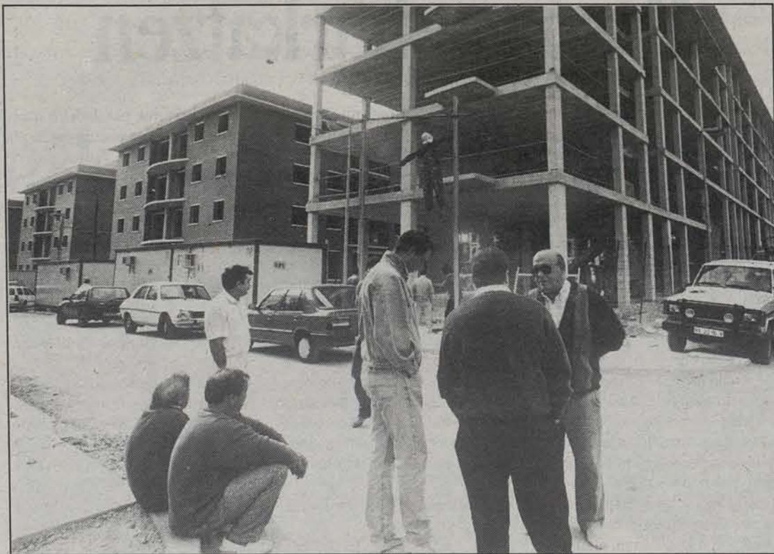
VITRA kooperatibak izan ditu arazo franko azkenotan.

Bitartean Burlatako enpresa pribatuak garbitzen ditu kaleak, Viveros de Navarrak jasoten du zaborra, eta Eguesibarkoa da taxi bakarra. Autobusik ez oraindik, eta auto pila, andana. Arratsalde partean heltzen dira gehienak, etengabe. Denek zeharkatzen dituzte kale hutsak eta elkarri behatzen diote, begirada azkarraz, ezagutzen ote duten ikusteko. Agur gutxi, eta etxera. Amestutako etxeetara.