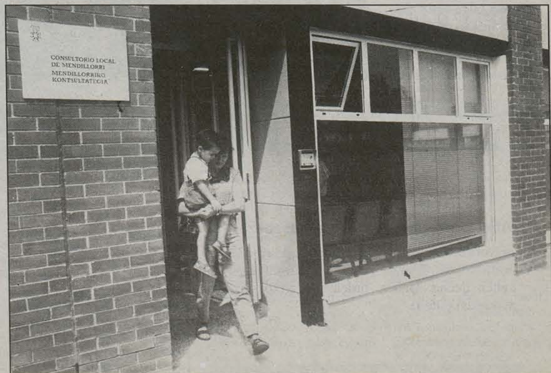
Hiria bere itxura hartzen ari den bitartean, haurrak dira nagusi toki orotan.