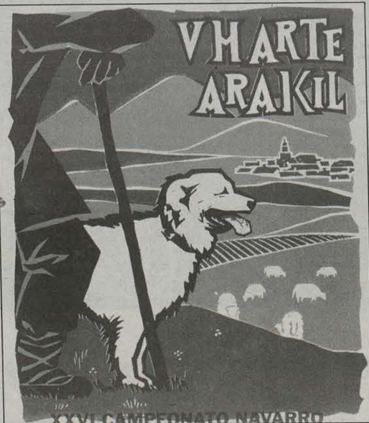
Geinberan txakur eta artzain onenak bilduko dira.

eta ezagutza behar dute». Bere ustez, Nafarroako zelaietan badira beste gauzak, baina mendiko nekazaritzarentzat ardiak funtsezko garrantzia dauka. Hau kontuan hartuz, «Artzai Eguna bezalako ekitaldien garrantzia oso handia da».