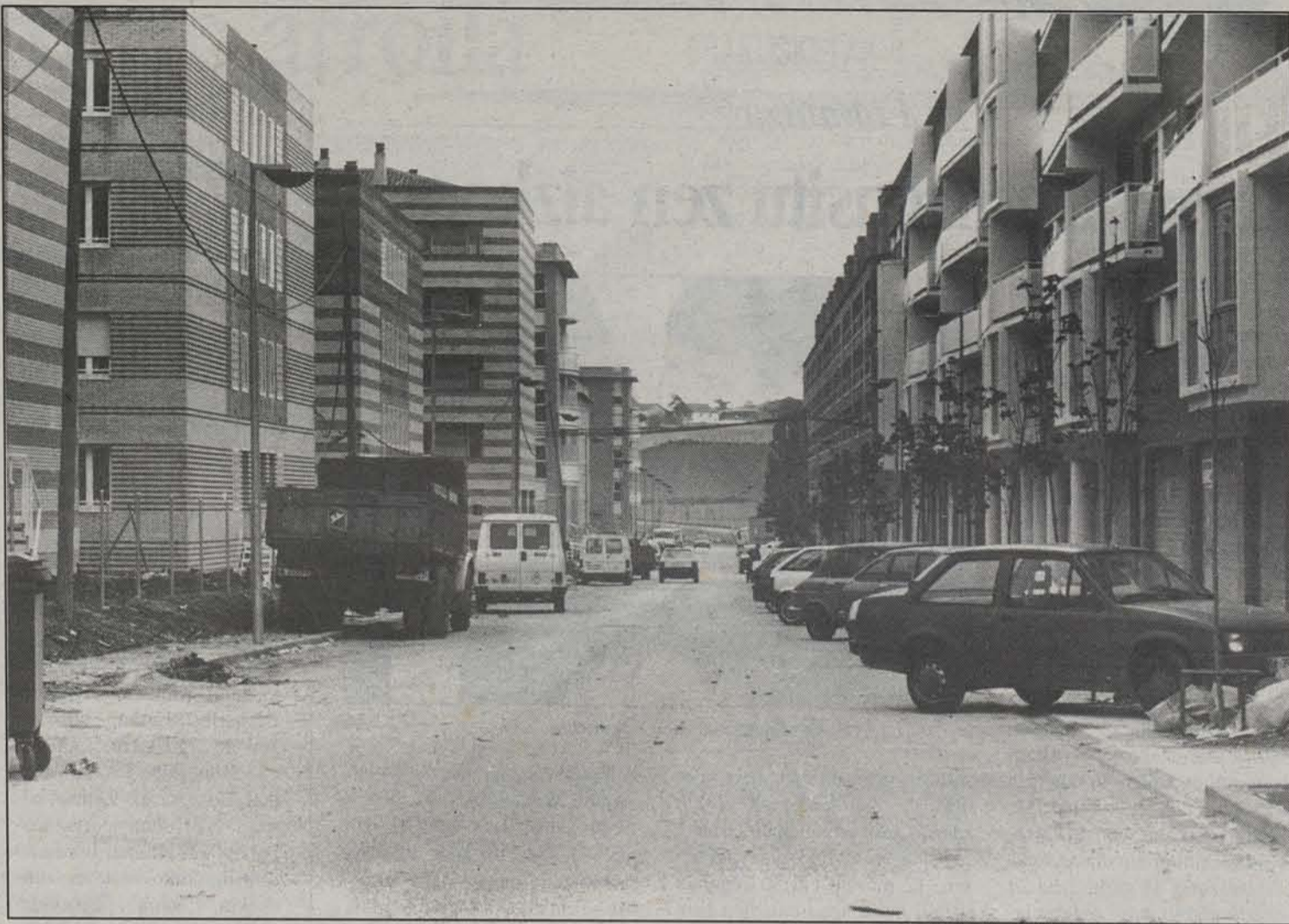
Obraz eta autoz beteriko hiria da egun Mendillorri.

Oraindik, baina, amestutako hiria hiri hutsa da, nahiz eta jendez beterik egon. Dendarik ez, zerbitzurik gabe, konponketen zarata da nagusi, eta bertan dauden hiriaren lasaitasuna azpimarratzen dute. Badira, baina, bertan bizitzeko zorterik oraindik izan ez dutenak, arazo franko izan baitituzte kooperatibek eta etxegileek hiru urte hauetan. Berriena VITRA kooperatiben etxebizitzaren atzerapena. Hala ere, gero eta hiri erreala da Mendillorri, batzuek oraindik ametsa besterik ez bada ere.