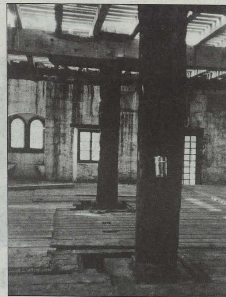
Dorrearen jatorrizko zutoinak.

Martin Ursuakoa 1480an jaio zen bertan. Pertsonaia honen bizitza garai hartan Nafarroak jasan zituen gertakariekin biziki lotuta dago, Fernando Katoli-