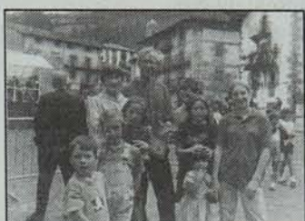
Etxe trukaketa: kanpoan etxean bezala/vii