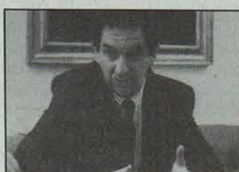
Etxegarate zabaltzea 'premiatzkoa' Altsasuko alkatearendako/viii