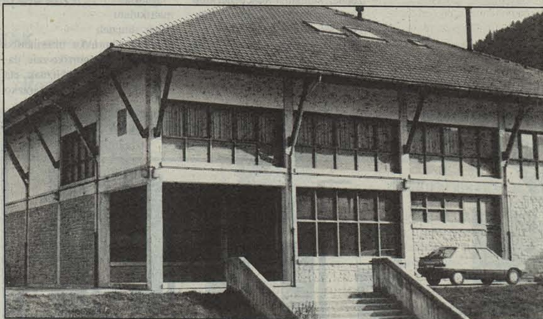
Ibarreko batzarrak Ezkarozen duen egoitza.

Egoera ulertzeko, esan beharra dago ez ohi-zeko gastua onartzeko 18 batzarkidetatik hamalauk eman beharko lukete aldeko botoa. «Herri txiki-txiki jendeak esaten du bakarrik herri handiek aterako dutela etekina edozein inbertsioetatik eta banaketa dute nahiago».