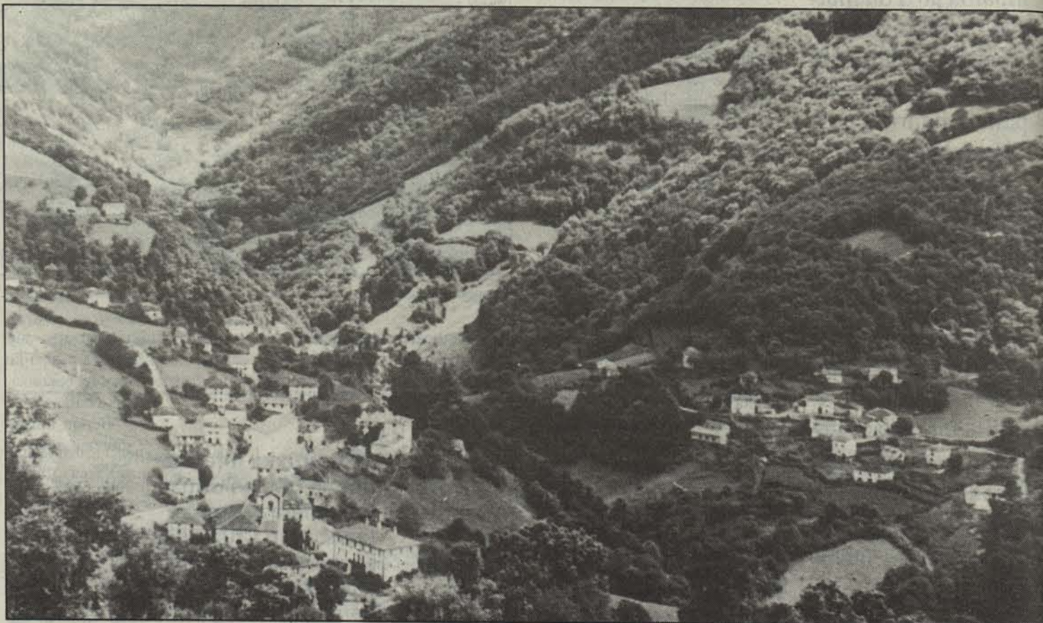
Zaraitzuko malkartasunak berak ez du gehiegi laguntzen aurrera egiteko.