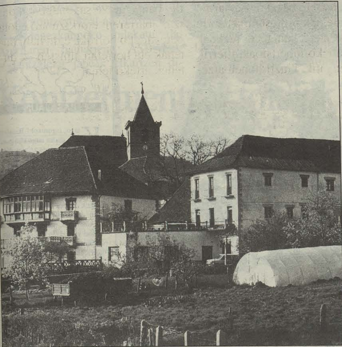
Inon baino gehiago, bertako gazteek dute giltza.