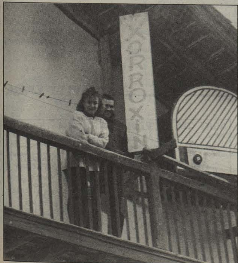
Iruiritako etxe zaharreko balkoian.

Zortzi orduko emankizunak eman beharrak irratia «freskotasuna» kendu diola aitortu dute, «buruhauste franko etortzen bait da beste alde askotatik». Hala ere, baikortasuna somatzen zaie, zakukada, 23.000 pertsonako entzulegoak ematen duen segurtasunarekin bizkarrean: «Irrati honek badu etorkizuna».