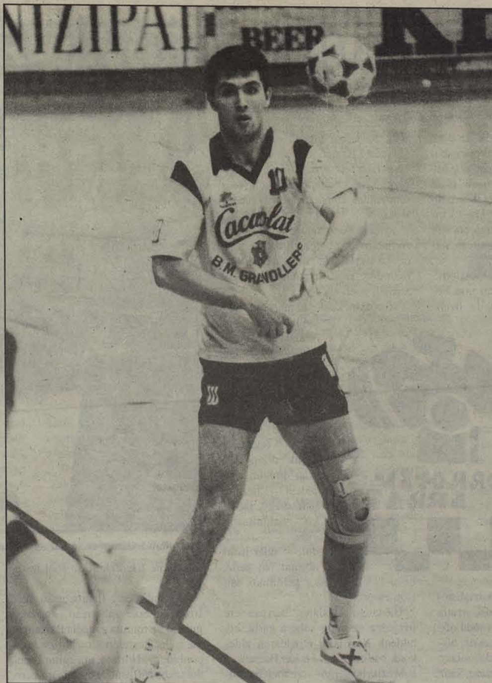
Lehen Cacaolaten ibili zen, baina Atletico de Madrilen jokatzen du egun Garraldak. J. CALLEJA

ustetan jokalaririk hobereenetakoa izan da. 22 urtekin egun Atletico Madrilen dabilen mutiko hau handien artean handiena izan daitekeela diote, eta euskal eskubaloijari pasatako garaia gogorarazi dizkio. Izan ere, horrelako izarrak ez dira egunero topatzen.