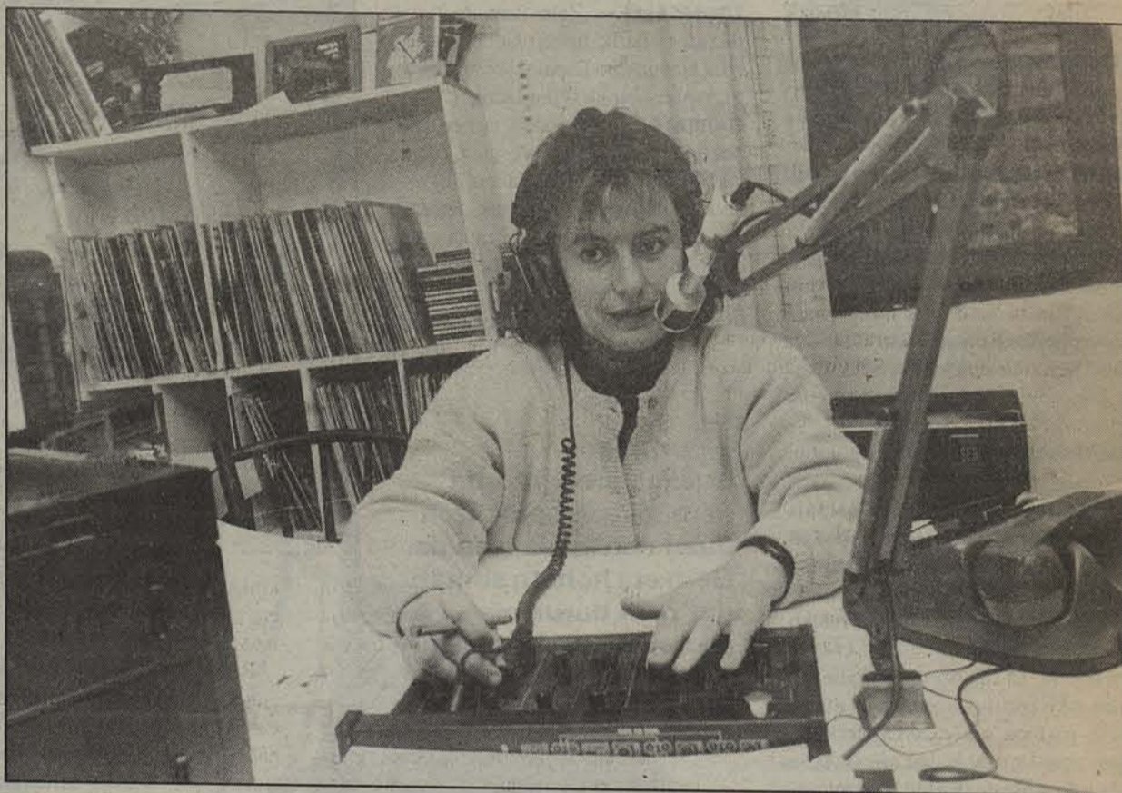
Mikrofonoaren aurreko lanaz aparte, herriz herriko kolaboratzaileak ditu irratiaik.