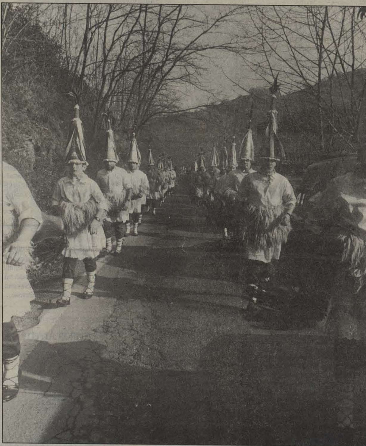
Joan den asteburuan hasi dira ihauteriak Nafarroako hainbat herritan.