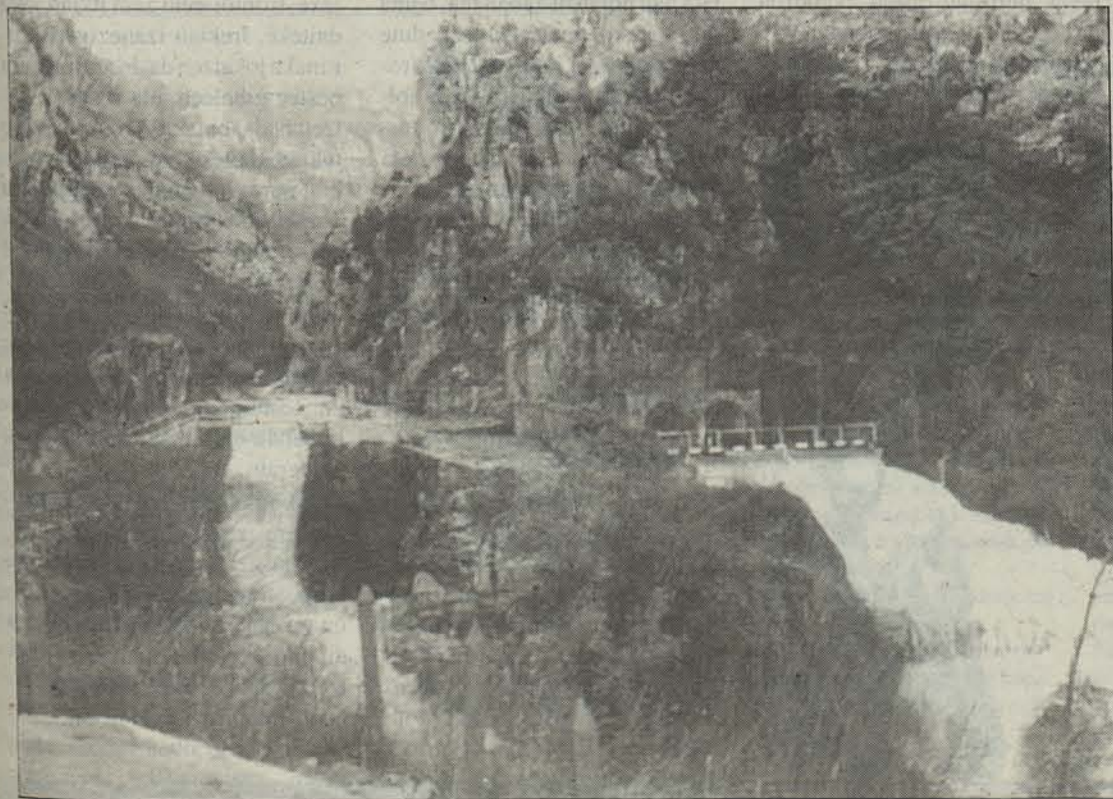
Artetako ura Iruña hornitzeko erabiltzen da.

Ur horien kalitatea aparta da, oso mineralizatuak direlako, baina desberdinak dira zonaren arabera. Aipatutakoetan Erribera aldekoak baino kalitate handiagoa dauka urak.