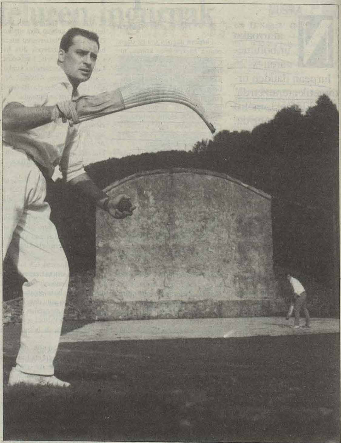
Frontoi irekietan jokatzen zen behialan joko-garbian.

Partiduak berrogeira izango dira, baina hogeitamarrera helterakoan, soilik bigarren mailakoak arituko dira jokuan, eta besteak erretiratu dira. Honekin, Etulain horren antolatzailetariko batek adierazi duenez, maisuengandik ikasteaz gainera,