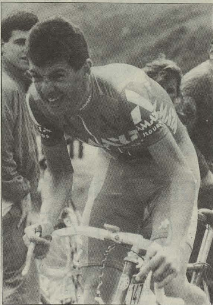
Euskal Herriko Itzulian.