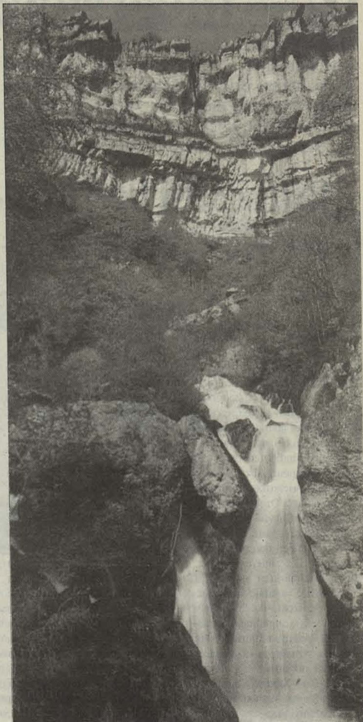
Urederrako iturburutik ateratzen da Urbasako ura.

Baina Urederrako iturbura da azpimagarrienetakoa, bera baita Urbasako aterabiderik garrantzitsuenak. Ur garai handietan 50 m 3 /sgkoraino hel daiteke. Izan ere, Urbasako estruktura