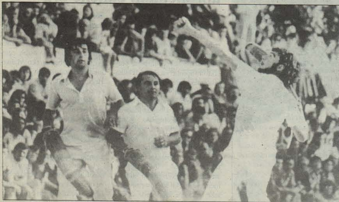
Egun Lapurdi eta Nafarroa Beherean du indarra.

Joko-garbian, ordea —eta hortik bere izena—, pilota jaso bezain laister jaurtitzen da, baina kolpea eman gabe. Horrela, esku-muturrak bi uneko jokua egiten du pilota hormaren kontra bidaltzeko. Egun, indar handia du jokuak Ipar Euskal Herrian, Etulainek esaten duen bezala «han jokua mantentzeko benetako gogo eta grina izan dutelako».