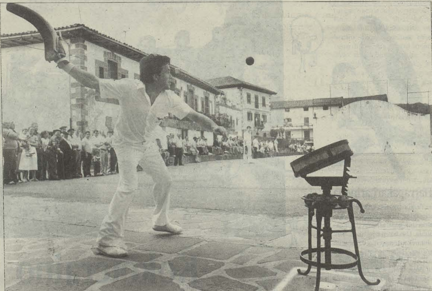
Iruritarako frontoian laxoan jokatzen.

BOTARRIAK ETA ESKASAK Egund, zelai errektangularrean jokatzen da laxoan, 50-70 metrotako luzerakoa eta 12-20 metrotako zabalerakoa.