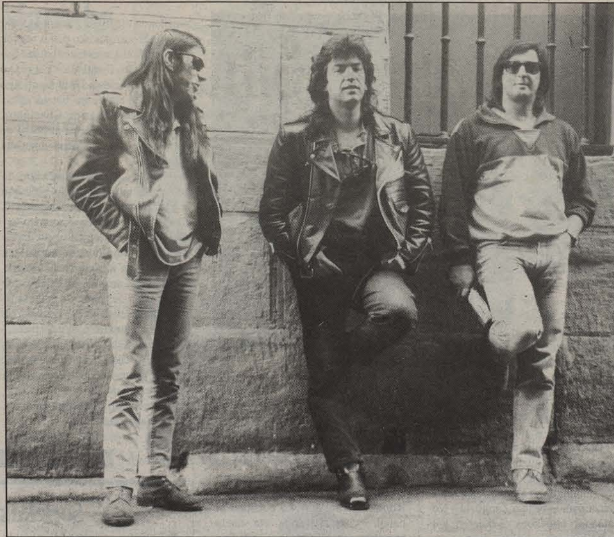
● Iruñean musika talde franko izan arren, rockaren bideari heldu nahi diotenenk oztopo ugari izan ohi dute aurrean. Askok ortu dute hala ere aurrera egitea, argazkian diren Barrikadakoez esate baterako. ANDER GILLENIA

Kontzertuak egiteko leku aproposa ez bada egiten, Iruñeko rock taldeok oso gaizki edukiko dugu aurrera ateratzea.