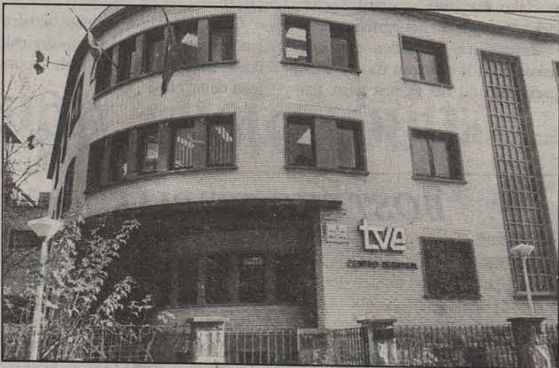
Telenavarrako Iruñeko egoitza.