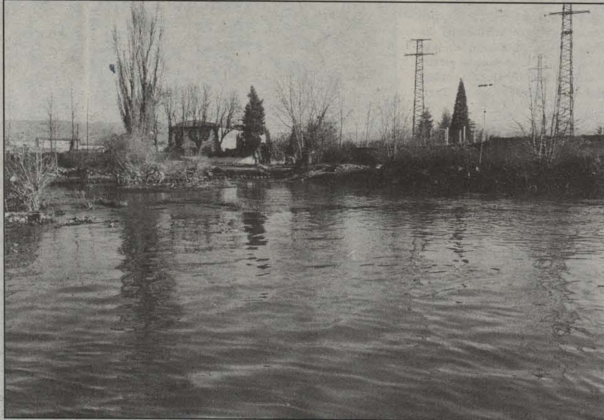
Arga ibaia Iruñeko Magdalena auzotik igarotzerakoan.

Lan horien helbururik azpimagarriena inguruan dagoen landarediaren berreskurapena izaten da, eta horretarako lehendabizi tokiaren azter-