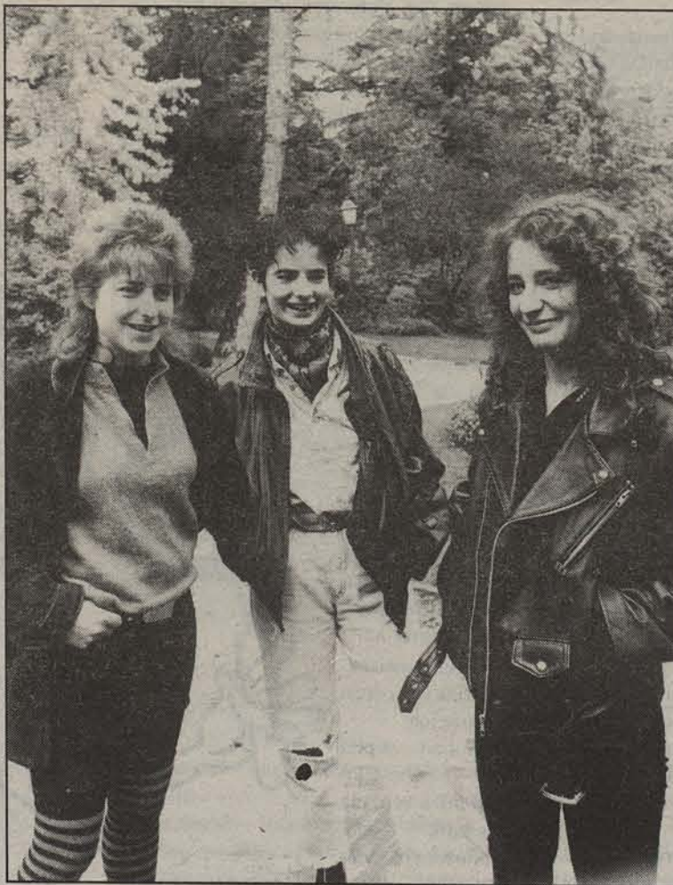
● Matrakako kideak taldea desegin baino lehen.

Nafarroako giroa nahiko ondo dagoela uste dute, talde asko sortzen dira, batez ere 'heavy' musika jotzen dutenak. «Baina arazo asko izaten dira, entseiatzeko leku aproposak aurkitzeko, diru laguntzarik ez izatean, eta abar», diote. Hasiera guztiak gogorak dira, baina poliki poliki aurrera jo behar dela garbi dute. «Gu prest gaude edozein lekutan eta edozein momentuan musika jotzera joateko, toki handi edo txikietara».