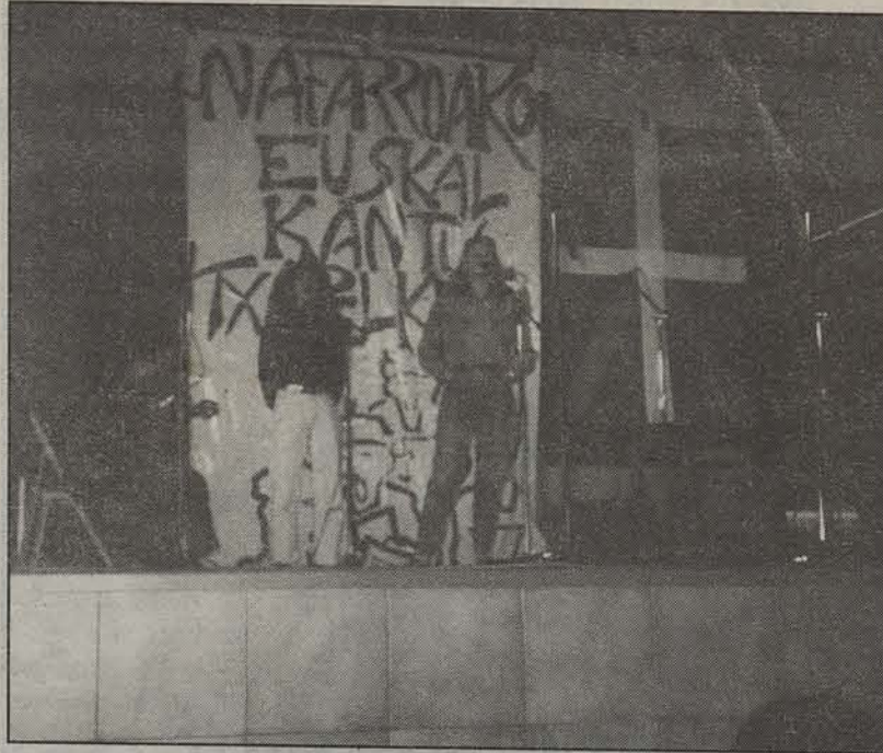
Doneztebeko Bordatxon izan zen aurtengo finala.