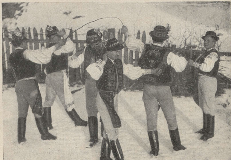
„Popodpalíčki“ 3ème figure. Podzámčok, Zvolen. ž., Slovaquie.