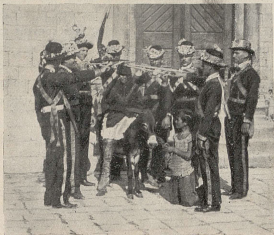
„Poklad“ 4ème figure. Lastovo - Dalmacie, Lagosta - Italie.