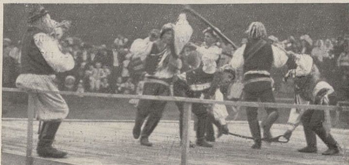
„Pod šable“ 2 ème figure. Strání, Uher. Brod, Moravie.