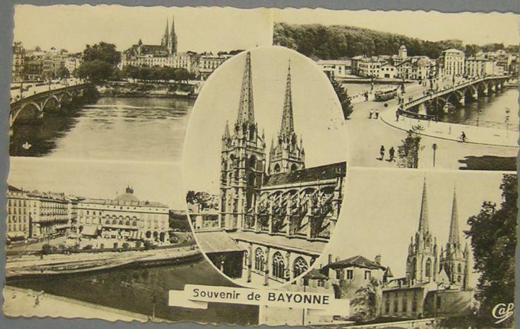
Souvenir de BAYONNE