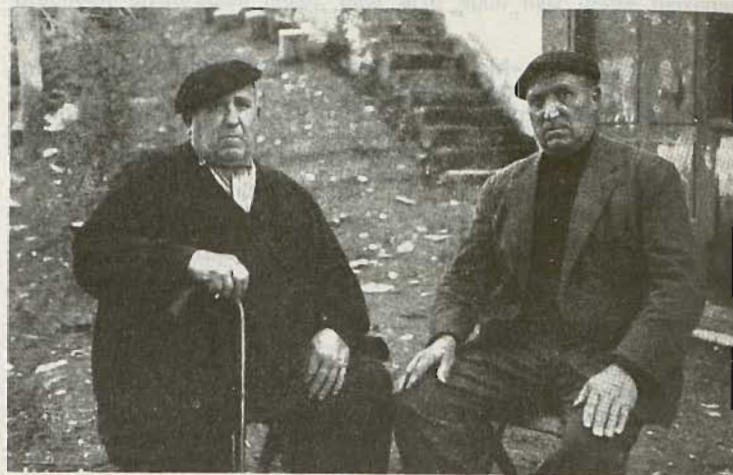
Txirrita ta Saiburu Eibarren, 1980

Hogei eta bi urtetarako nintzen ezkondu na'iean, hiru hogei ta bederatzitan oraindik nago gaiean. Lehenbiziko ene pregoia botatzen duten jaiean, suzku zezenak izanen* dira Donostiako kaiean.