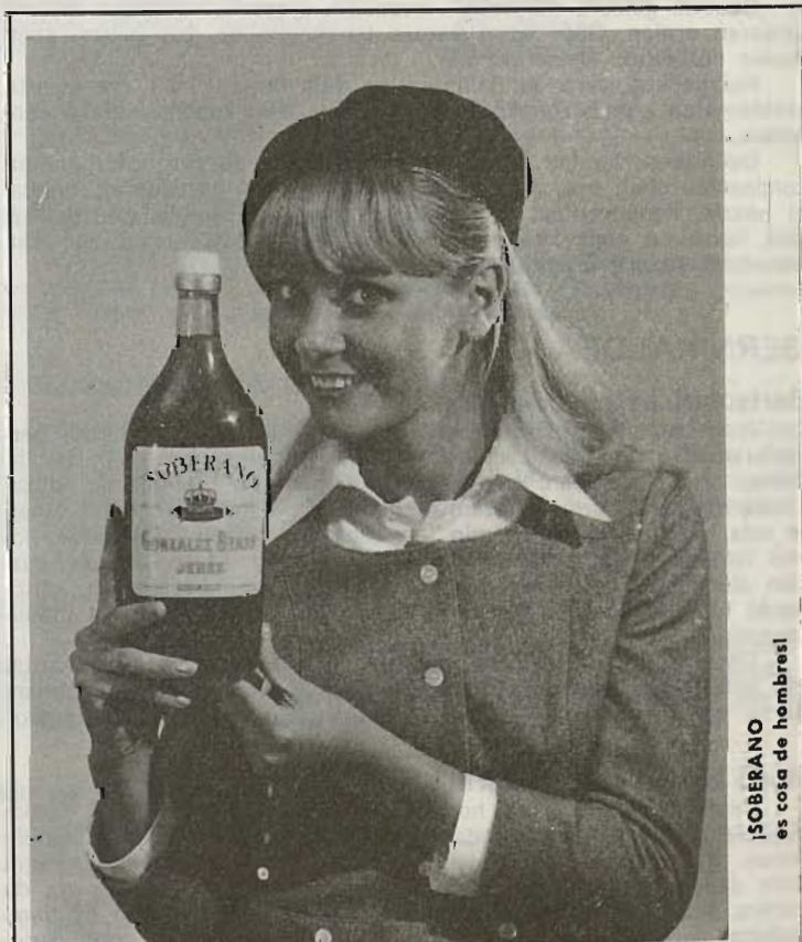
¡SOBERANO es cosa de hombres!

Bal mutiko eta bal neskatoentzat, kolonia bi eratu ditue Iparaldeko «Eskualdun Xoriak» elkarteok: uztailaren* 8tik 31ra Ternose-n, eta abuztuaren 5etik 26ra Milafrangan. Argitasun gehlagorako: «Eskualdun Xoriak», 9, rue des Prébendés. 64, Bayonne, France.