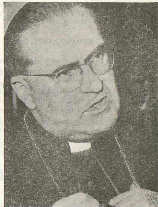
Doepfner kardinala, Munich-eko artzobispoa