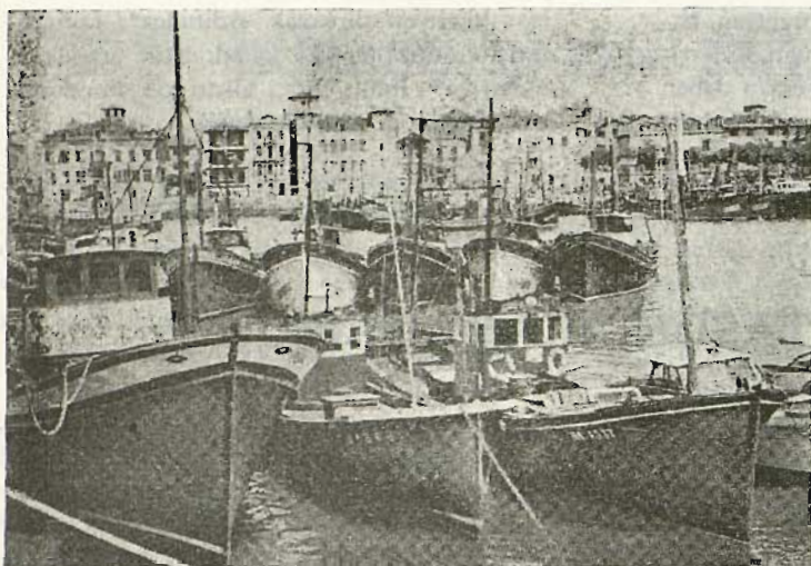
Donibane Lohitzuneko portua

Arvaintza ta industria naikorik ez dago gure gazteentzat.