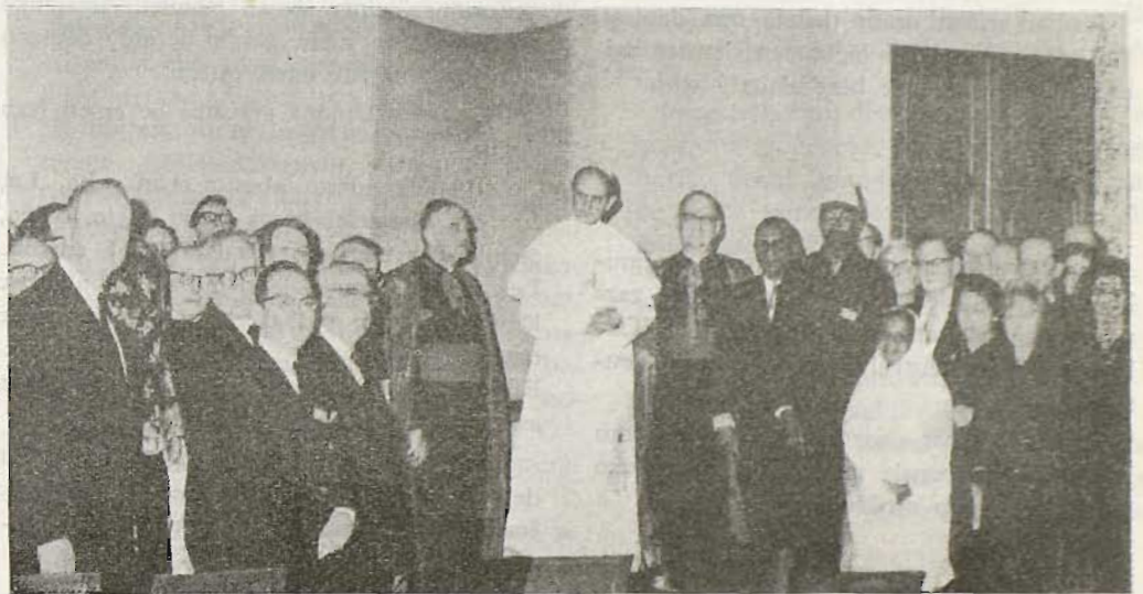
Aita Santua, entziklikea egiten lagundu deutsoenakaz.

Katolikuen artean be, desbardiñak dira eritxiak. Eta desbardintasun onetan, ba dauka zerikusirik geografiak. Nongoak direan katolikuak, alakoxeak dira gitxi gorabeera eritxiak. Errialde anglo-saksonetan, sakon sustraituta dago aspalditik jaiotzen kontrola, bai gogoetan eta bai ekanduetan*. Errialde orreetarik* etorri dira kri-