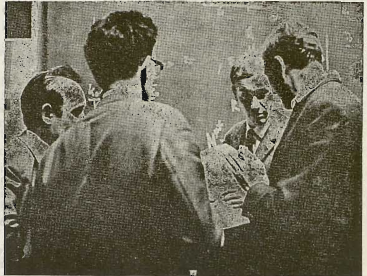
Gizarte giro berezi bat bear da egtazko alkar izketarako.

Zintzotasuna. Norberaren siñesteari, aldakuntz bako egia-ri, balio nagusiei, aurretik iñori salduta egon barik, itzerdi barik, leial iokatuaz norberaren eta bestien eritxiei begira.