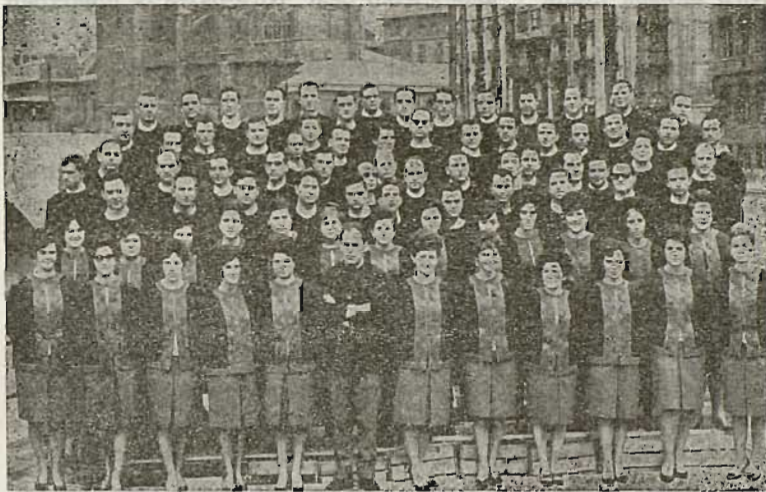
SAN ANTON ORFEOIA