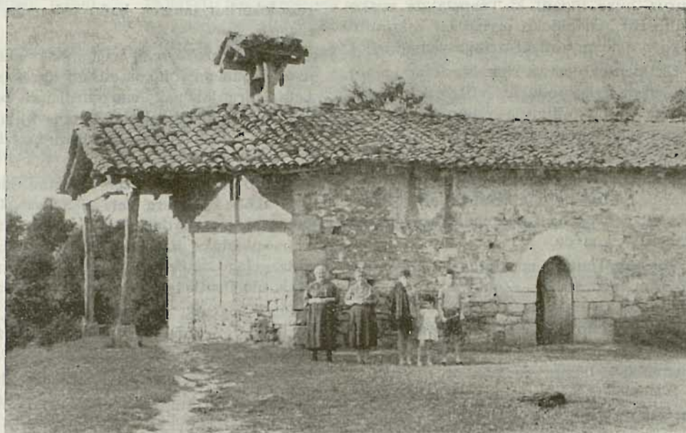
Ugarte'ko S. Bizente, Bizkaiko eleiz zarrenetariko bat.

Nun dago erri au? Euskalerriraren biotz-ondoan. Biotza Gernika da; ta biotzaren ondoan ba dauka Euskalerrriak Muxika'n osasuna, biotzean baño geiago. Nik esango neuke Gernika'ri euskaldun antza emoten dautsona, Muxika dala, muxikarrak. Igande ta astelenetan, goiz nai arratsalde, euskera entzuten badozu, lautatik bi muxikarrak dira.