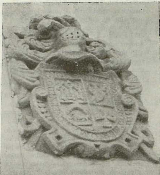
Muxika'ko iauregi zaar baten agertzen dan eskudua.