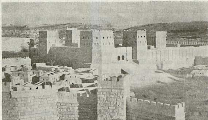
Erromatarren sasoian entzute andiko zan «Torre Antonia» orma bikaiñak Jerusalem barruan barriztuak.

«Datorren urtean, Jerusalem-en». Lelo onegaz agurtuten izan oi dira orain arte atzerrian bizi izan diran judutarrak. Ta lelo au gaur egiaren maillara elduta ikusten dogu, Israel-go gobernuak Jerusalem uriburu osoa bereganatu dauanatik. Gertakizun onetik batez be sortalde erdiko gorabera illunak bein da barriz ezbaitsu ta komentaduenak dirala esan daikegu. Arabetarrak antza urduri jarraituten dabe oraindik judutarrerri atzamarkada on bat noiz emongo. «Ondamendia —esan dau Cairo-ko Gumhuria egunerokoak— onartu gura dabenentzat bakarrik etorri daiteke; guk, orraitio, ondamentian jausi garanik ezin dogu siñistu.» Gorabera oneen garrantzia eguneroko eta gaiñerantzekoak esandakoakaitik ezin dogu atarazo, sortalde erdiagaz zer-ikusitu dauken aberrien jokeretik baiño. Sortalde erdiak sortu dauan garrantzia gertakizun iru onetan adierazten dala esango neuke nik, beste batzuk be ba dagozala ukatu barik: Kosygin jaunak Johnson Ipar-Amerikako lendakariari egin deutson ikustaldi garratzen, Podgorny eta Errusia-ko gudari-taldearean nagusiak R. A. U.-ra egin daben ibilaldian, ta azkenik, sortalde erditik gero ta petroleo gitxiago elduten dan ezker, Europa aldeko aberrietan sortu dan larritasunean. Gertakizun oneen zertzeladak oraindik ixiltasunean dagoz. Baiña alan da guztiz be, politiku nagusien ardurea sortalde erdian jarrita dagola argi ta garbi dierazten deuskuela deritxot.