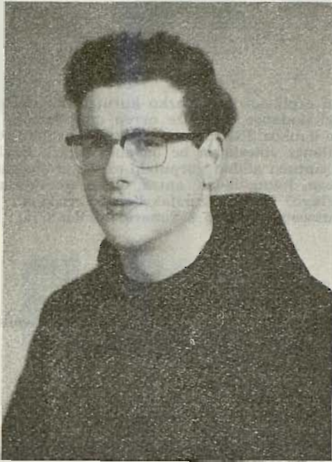
«TXORIA KAIOLAN» abestiaren egileagaz

Irakurleok, ba-dakizute aurten «Euskal Abestiaren irugarren sariketa» ospatuten dogula Bilbon. 132 abestietatik amabi aukeratu ziran. Ta, amabi orreitatik sei gelditu dira Euskalerriko erri nagusietan abesteko.