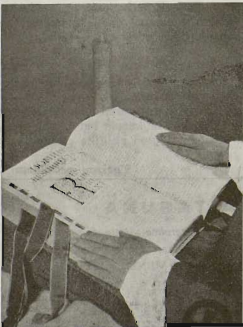
«Biblia irakurri: orixe da lenengo pausua».

tarako dan erakusten deusku, eta benetan animetan gaitu, liburu santu ori irakurteko, bere esangurea arakatuteko eta gero bere esanera biziteko.