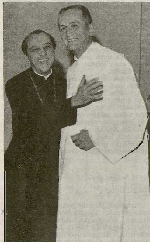
Batasunaren trudi bat: Helder Camara Brasileko «Arzobispo gorria», Taizeko F. Schutz monje protestanteagaz besarkaturik.

Amak beiñola, iauregi zaarrean emondako txingarra eztoigu umeok galdu. Oz-