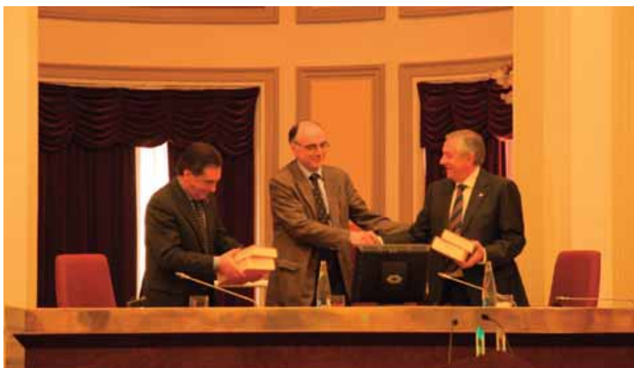
Euskaltzaindia's 90th anniversary, in Vitoria.

Representatives of public authorities attended all celebrations. In the case of Donostia-San Sebastián, the delegates from the four provincial councils attended - Álava, Biscay, Gipuzkoa and Navarre- which 90 years ago founded the Academy. They were joined by institutions that in this day and age recognise and believe in the activities of Euskaltzaindia: the Basque Government, Ministry of Education and Public Institution for Basque (Office Public de la Langue Basque).