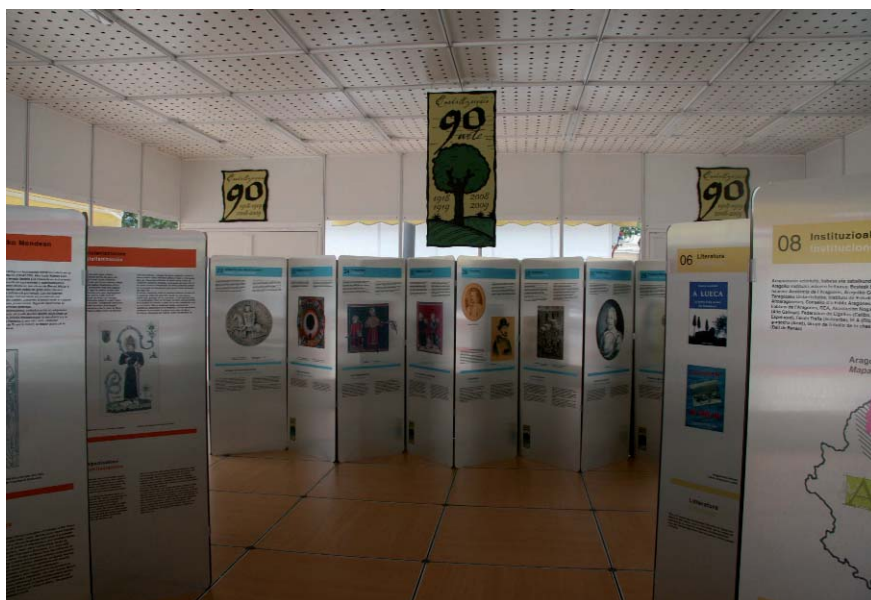
Vista de la exposición "Lenguas de los Pirineos: pasado y presente"

En julio, dentro de los Cursos de Verano de la Universidad del País Vasco, la Comisión de Investigación Literaria de Euskaltzaindia ha impartido en San Sebastián el curso "Gerra Zibila euskal literaturan (1936-2009)" (La Guerra Civil en la literatura vasca, 1936-2009). La organización ha sido compartida por Euskaltzaindia y dicha Universidad.