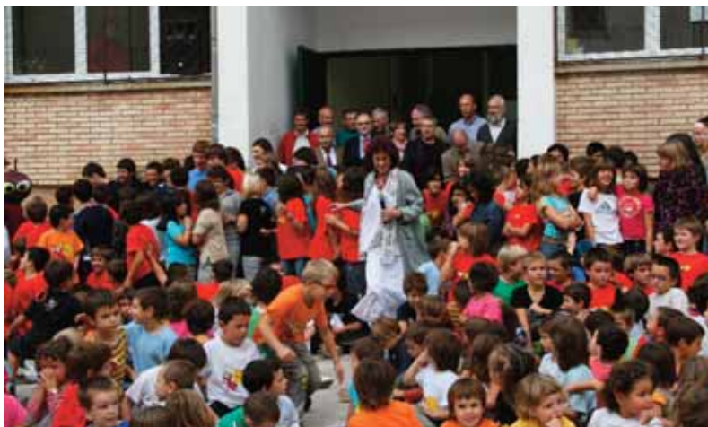
In Andra Mari school from Etxarri Aranz, participating in the commemorative events leading up to the celebration of Nafarroa Oinez