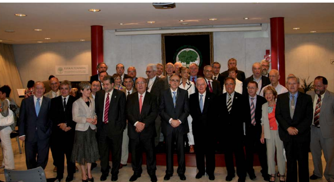
Bilbao, celebración del 90 aniversario. Los académicos de Euskaltzaindia junto a los representantes de la Real Academia Española, Real Academia Galega e Institut d'Estudis Catalans

Por otra parte, en el acto celebrado en Bilbao estuvieron los representantes de la Real Academia Española, Real Academia Galega e Institut d'Estudis Catalans.