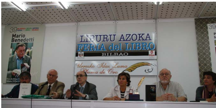
Euskaltzaindia à la Foire du Livre de Bilbao