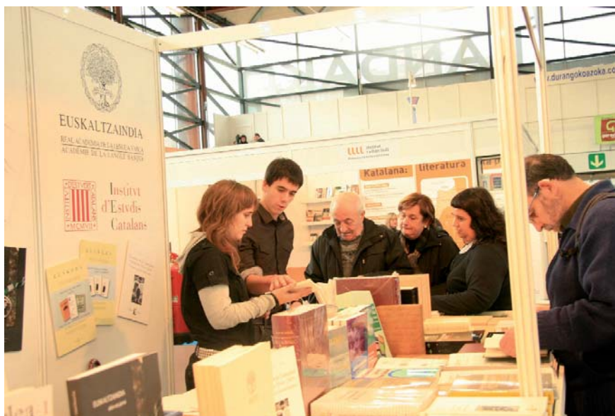
En la Feria del Libro y Disco Vascos de Durango