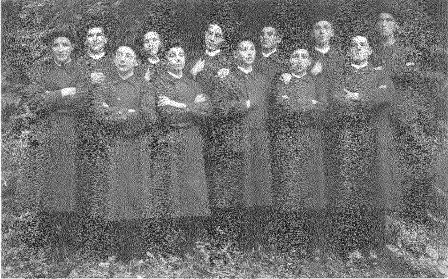
Ezkerretetik hasita, lehen lerroko hirugarrena Luis Villasante da. Arantzazun, 1934ean.