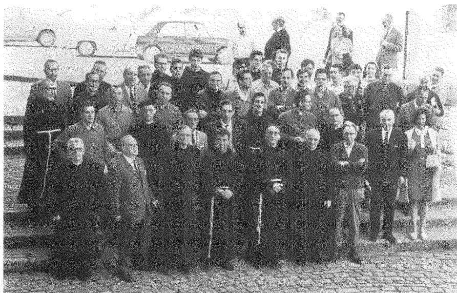
Arantzazun 1968.eko urrian bildutakoak.