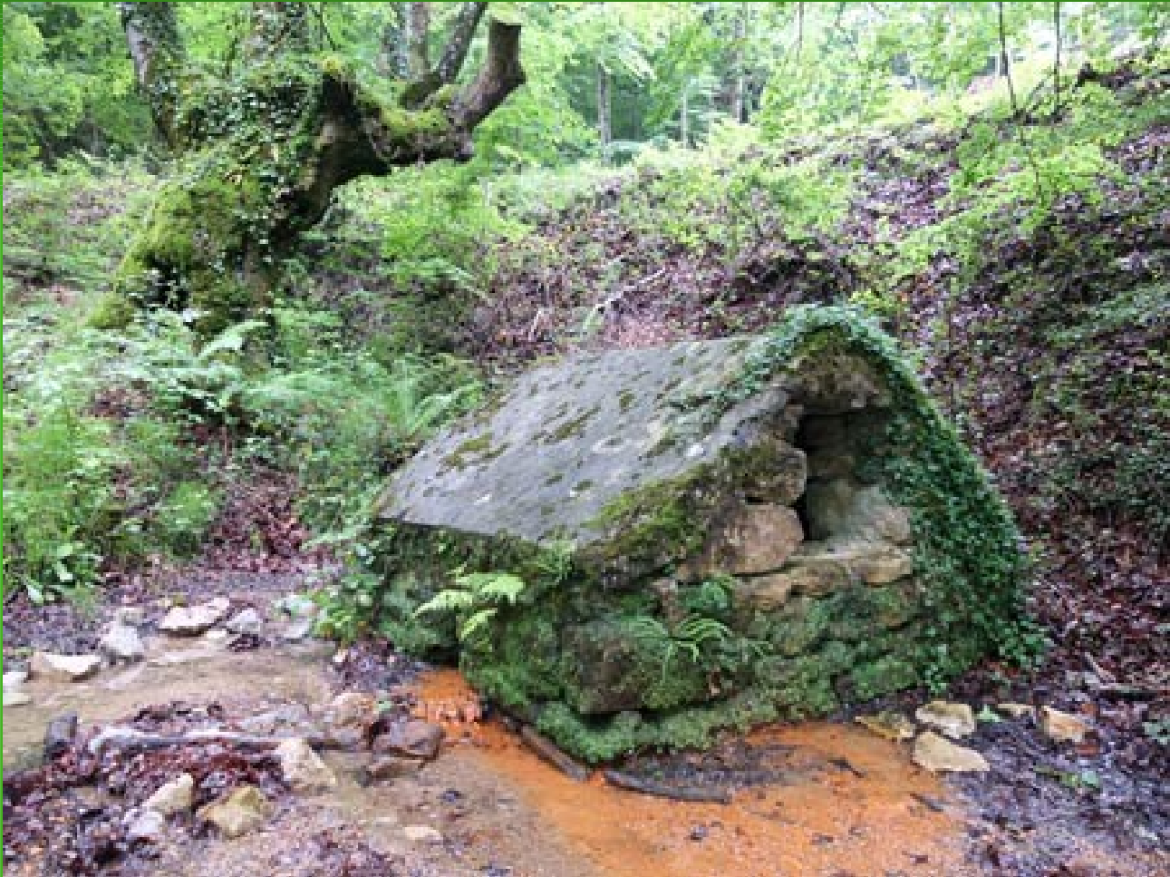
Olaztiko (Na) Metaliturri