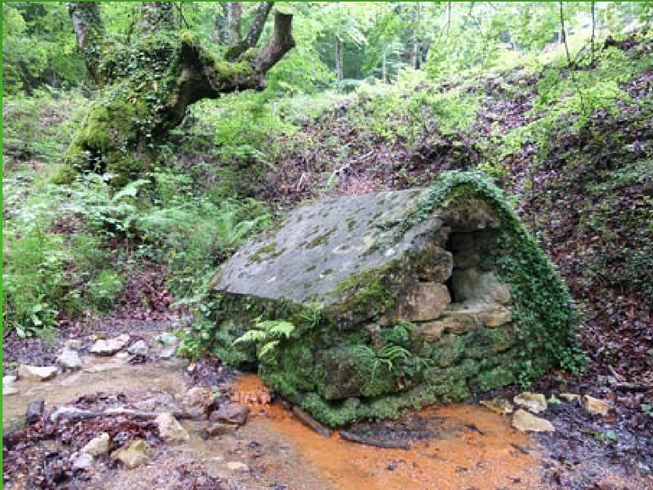
Olaztiko (Na) Metaliturri