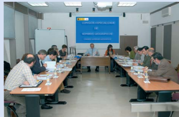
CENG batzordearen 12. bilera, 2008ko martxoaren 12an egina.