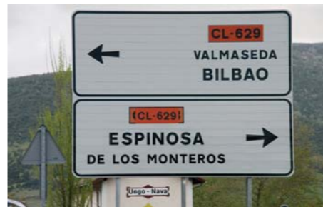
Bide-seinaleetan oker erabilitako toponimo baten adibidea: izen ofiziala Balmaseda da

Izen normalizatuen erabilera ezinbestekoa da toki bat zailtasun gabe identifikatzeko. Horregatik, oso garrantzitsua da herri administrazioetan, hedabideetan, kartografian, informazio geografikoko sistemetan, bide-seinaleetan eta argitalpenetan erabiltzea.