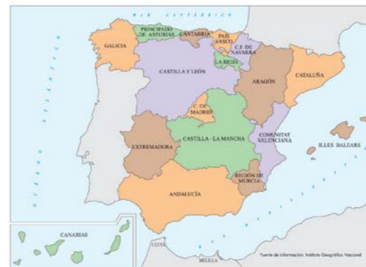
Espainiako banaketa autonomikoa

Espainian, toponimiaren normalizazioak kontuan izan behar du lurraldean hizkuntza bizi desberdinak daudela, eta egoera horrek hizkuntza-ahaztasuna ekartzen duela. Toponimoak gaztelaniaz normalizatuta ager daitezke, horixe baita Espainiako hizkuntza ofiziala. Horrez gain, autonomia erkidego batzuek berezko dituzten hizkuntza koofizialetan (galegoa, euskara, katalana edo valentziera eta arane-ra) edo beste hizkuntza eta dialektotan (asturiera, leonera, aragoiera) ere egon daitezke, toponimian askotan ahazko hizkuntzaren ezaugarriak agertzen direla ahaztu gabe.