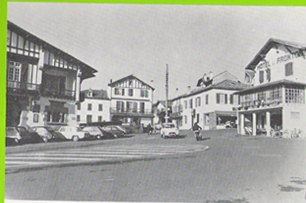
Etxe bildu eta egoitz xarmantez landatua den eskualdea.