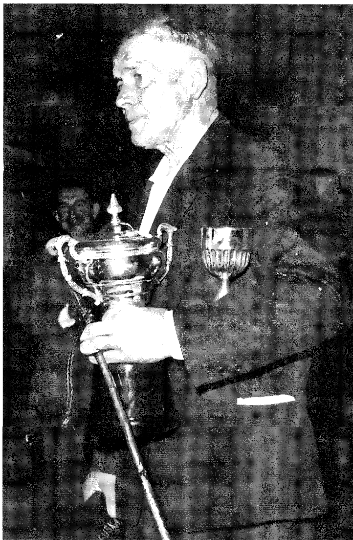
Uztapide, Donostian, 1967-VI-11-n, bertsolari-txapela irabazitakoan