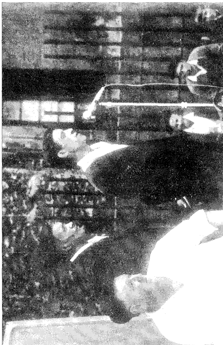
Uztapide eta Lasarte bertso kantari