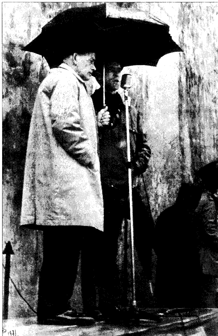
Uztapide eta Lasarte bertso kantari.