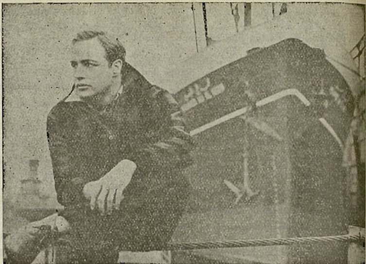
Yasako mutil asko dago oraindiño