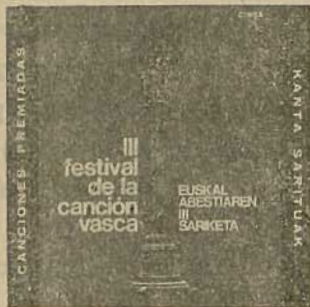
EUSKAL ABESTIAREN III SARIKETA