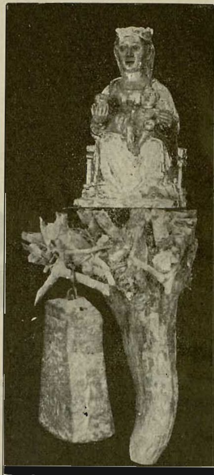
AMA zara-ta semien alde Zuk zer egingo ez dozu? Gure saminak gozotuteko Zagaz bai or Arantzaz Zui!

ete dogu bein da barrero aztu LEGE AUNDI AU? Maite ete dot neure anaia? Eban-jelioan agertzen dan gazte aregaz badiñotsagu geure amari: "Neure ume denporatik egiten dot ori", orduan, Jesus-en erantzuna be kontuan artu ta gorde bear: "Osoa izan nai badozu —nire maitasun legea oso-osoan gorde gura badozu— saldu dozun guztia ta emon bear-tsu diren anaieri".