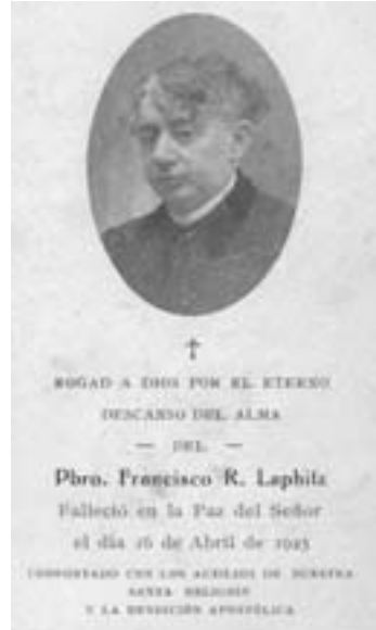
Horren iloba Ameriketako apezaren argazkia.